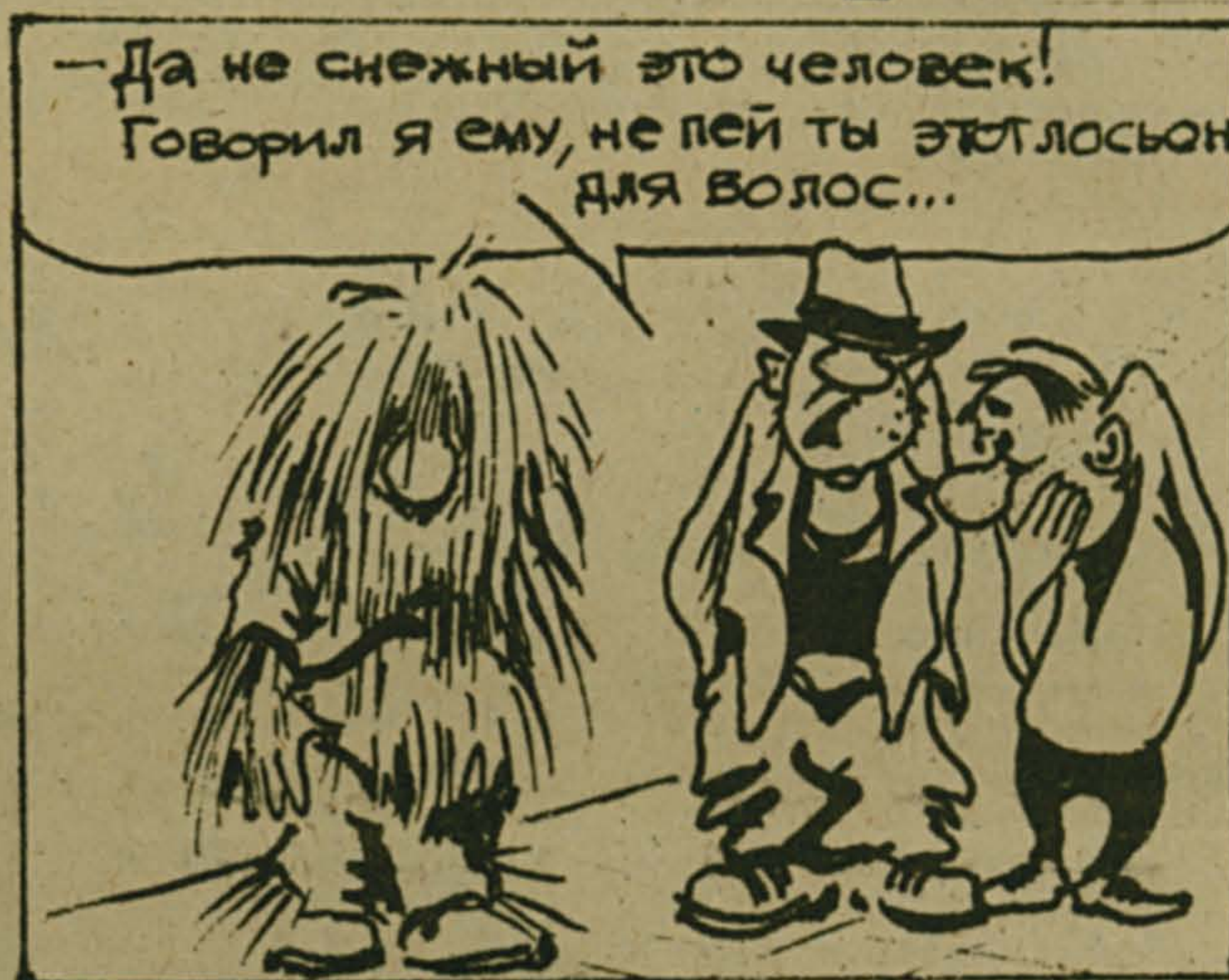
Рисунок Н. КАСИМОВА.

— Потому что я ужасно беспокоюсь, как бы звонок не прервал ваш потрясающе интересный урок.