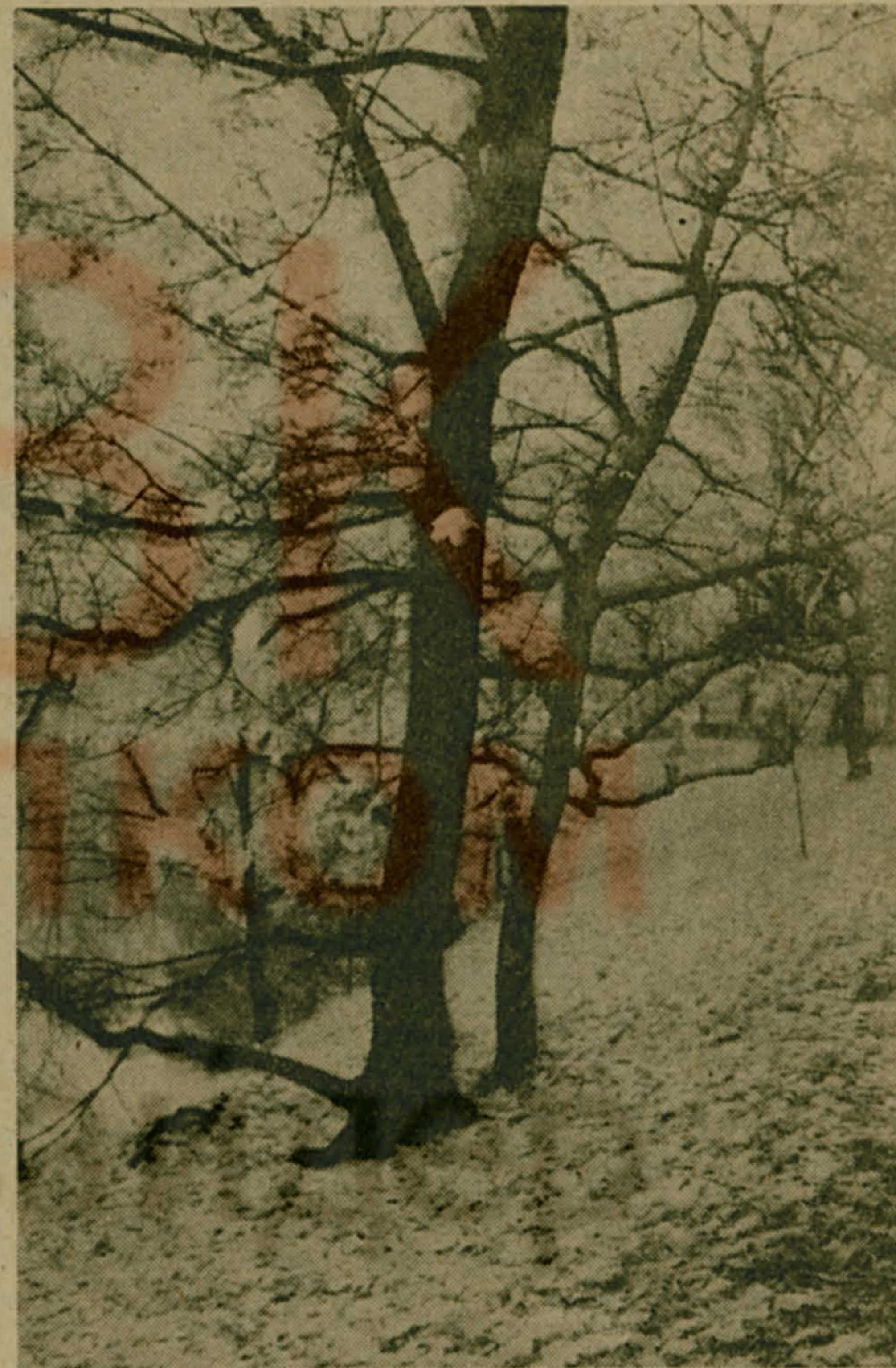
«Последний лист и первый снег...»

Цветочная пыльца используется при заболевании предстательной железы.