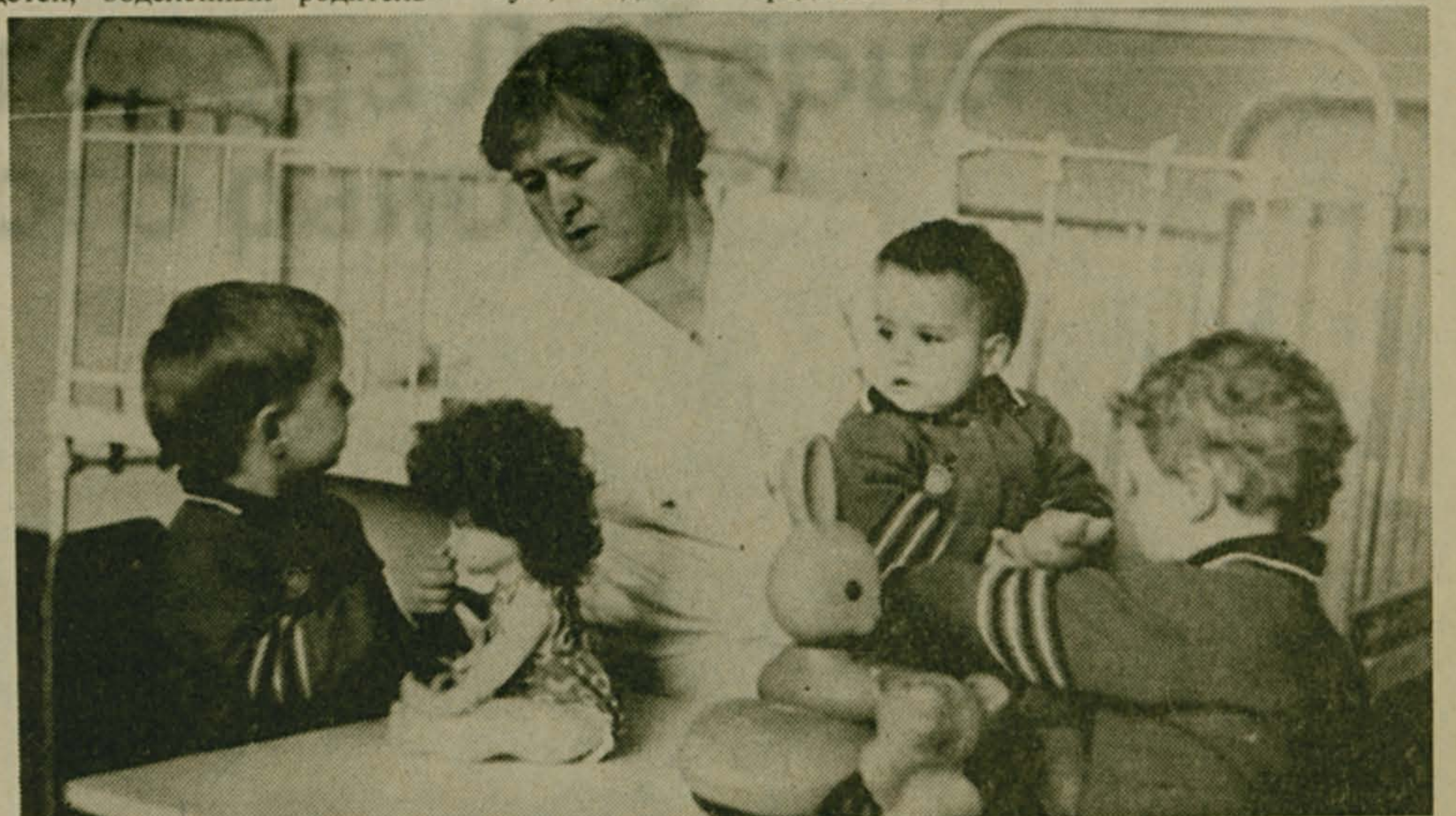
«Где моя мама?», «А моя?»