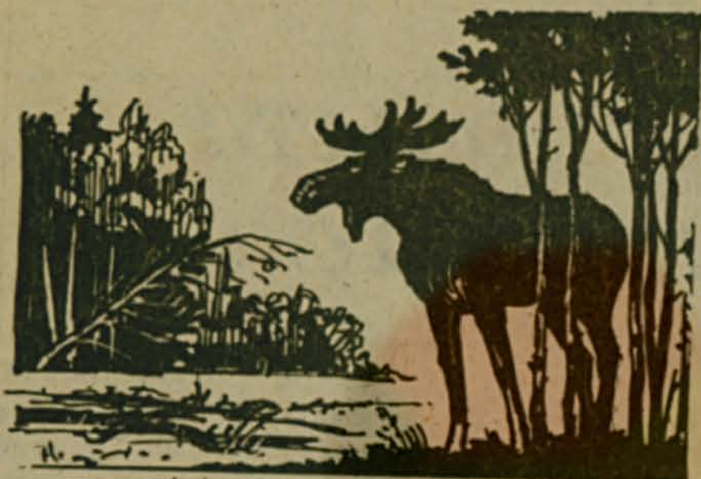
Рисунок Виктора Кунташева