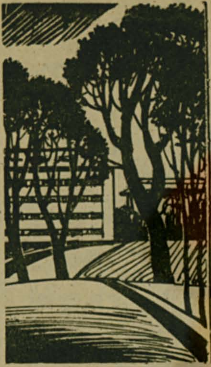
Рисунок Виктора КУНТАШЕВА.