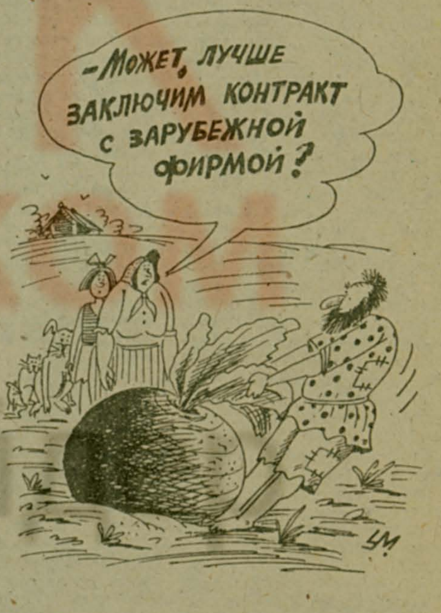
Рисунок Александра УМЯРОВА.

6 января: сборник мультфильмов — 11; спектакль «ПРО ИВАНУШКУ ДУРАЧКА» — 15; «ТАЙНА ВИЛЛЫ «ГРЕТА» — 13, 18; дискотека для молодежи — 20.