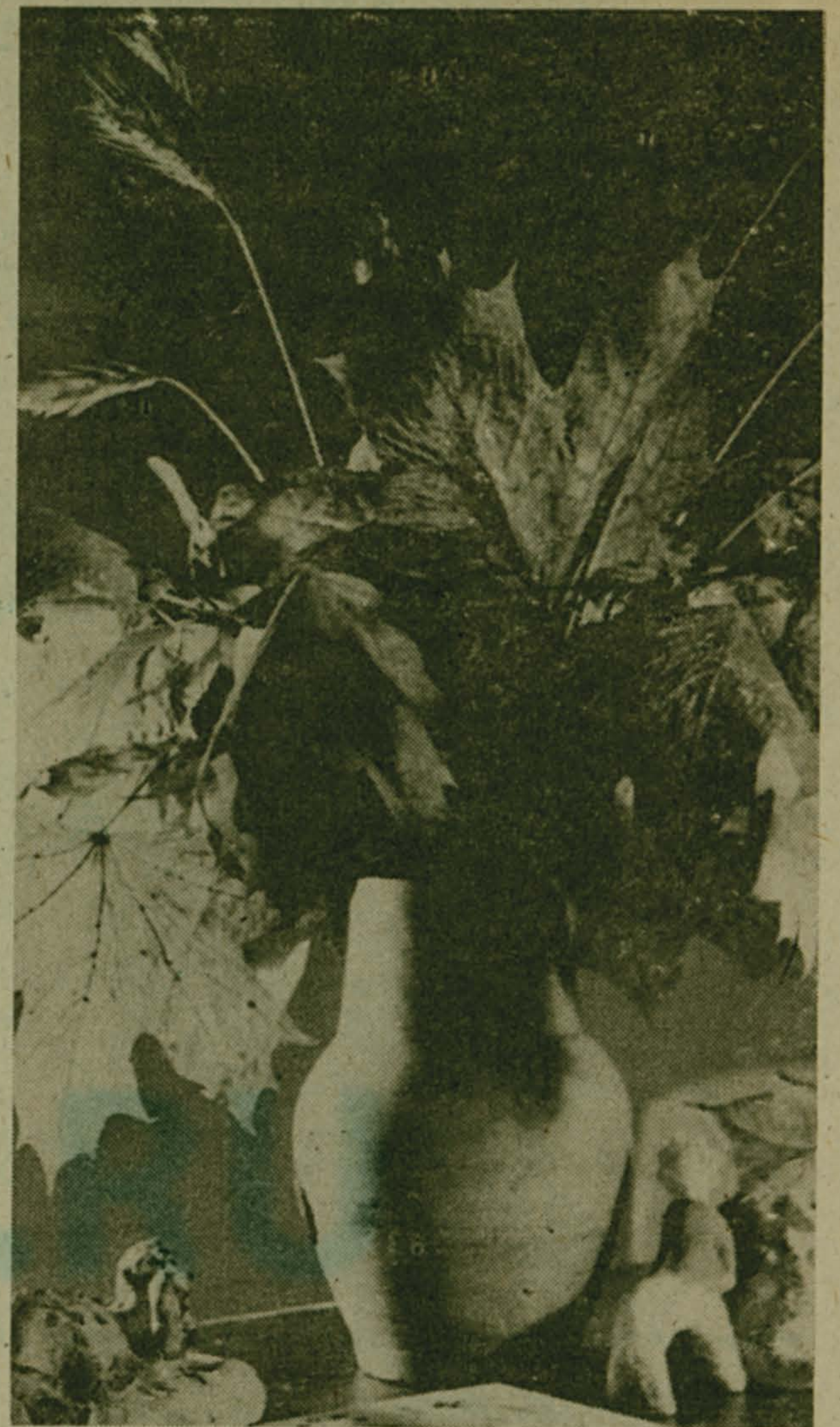
НА ПАМЯТЬ ОБ ОСЕНИ...