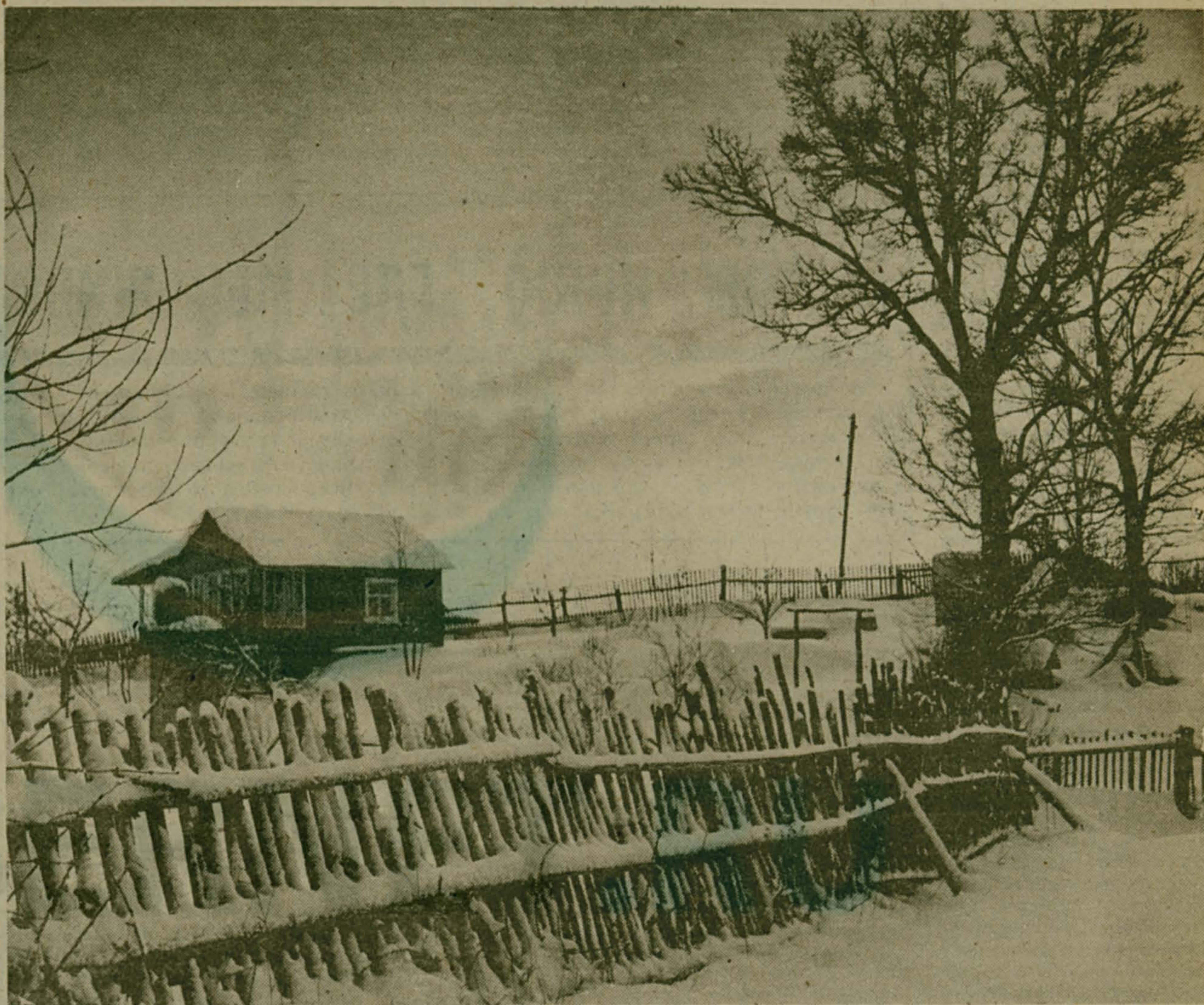
ВОТ МОЯ ДЕРЕВНЯ...

Рекомендуется также два раза в неделю делать увлажняюще-питательную маску. Для этого натрите яблоко и наложите его на лоб, щеки, шею. Вместо яблока можно использовать тонкие, как бумага, ломтики апельсина.