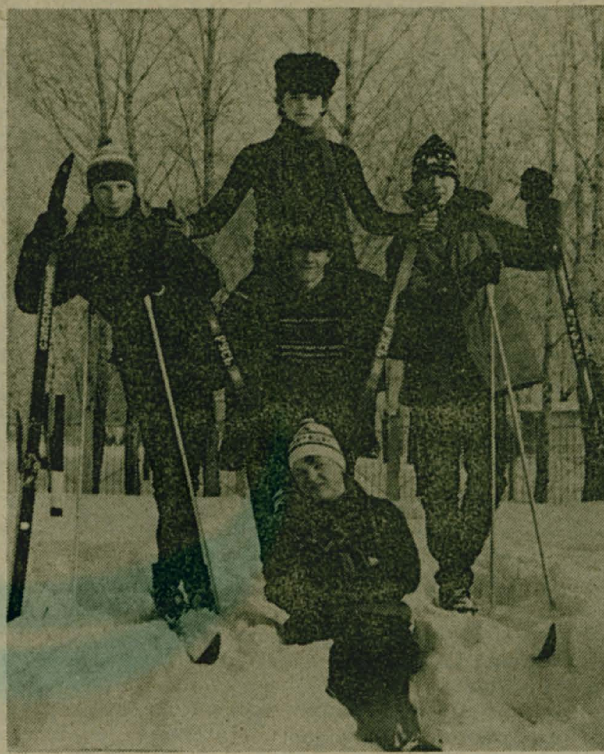
Хорошо на лыжной прогулке!