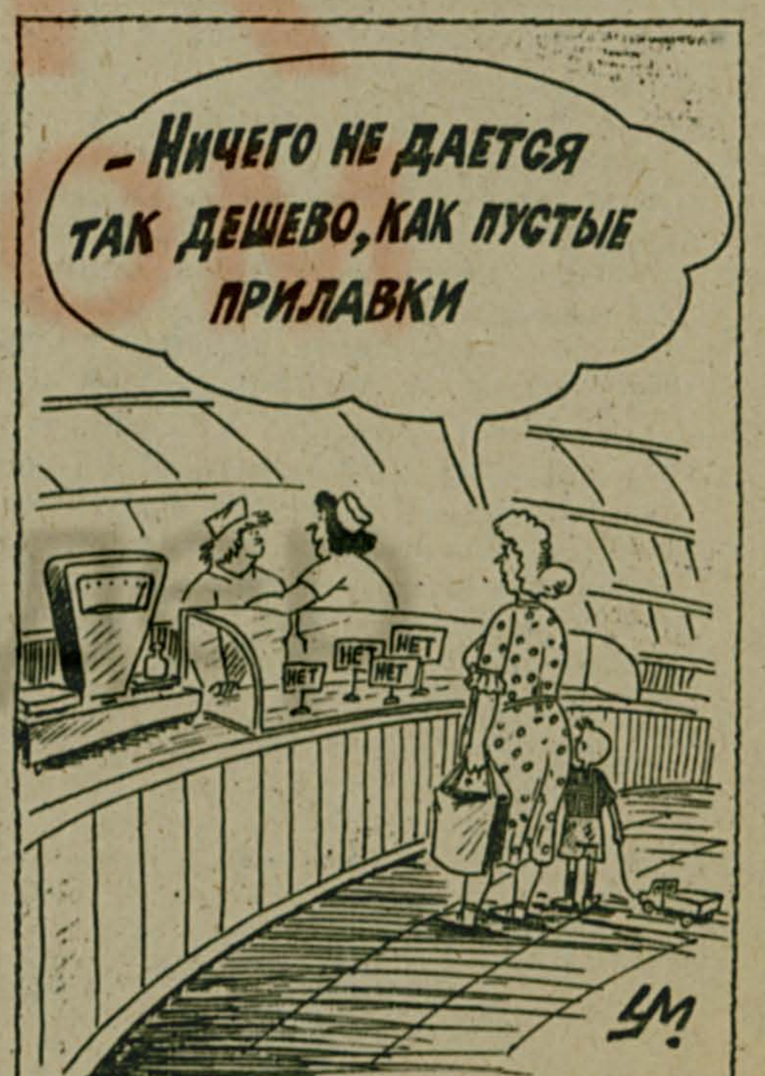
Рис. Александра УМЯРОВА.

Согласно экспресс-опросу, проведенному газетой, сотрудники ГАИ одобряют это решение. Много аварий, смертельных исходов на трассах происходит из-за безграмотности велосипедистов, незнания ими элементарных правил поведения на дорогах.