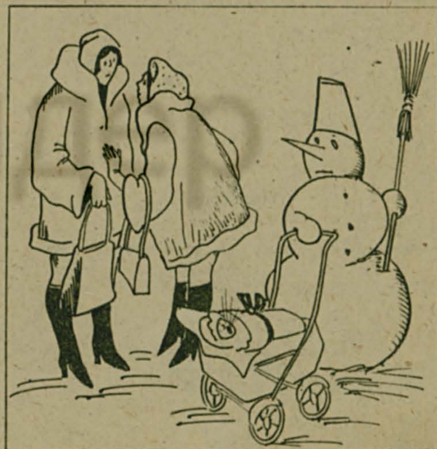
Рис. А. УМЯРОВА.