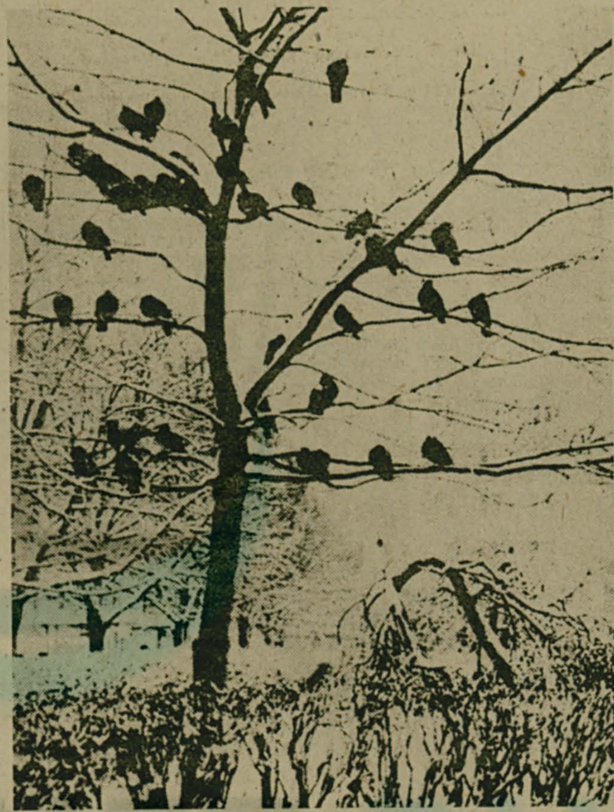
ПОСЛЕ СНЕГОПАДА.