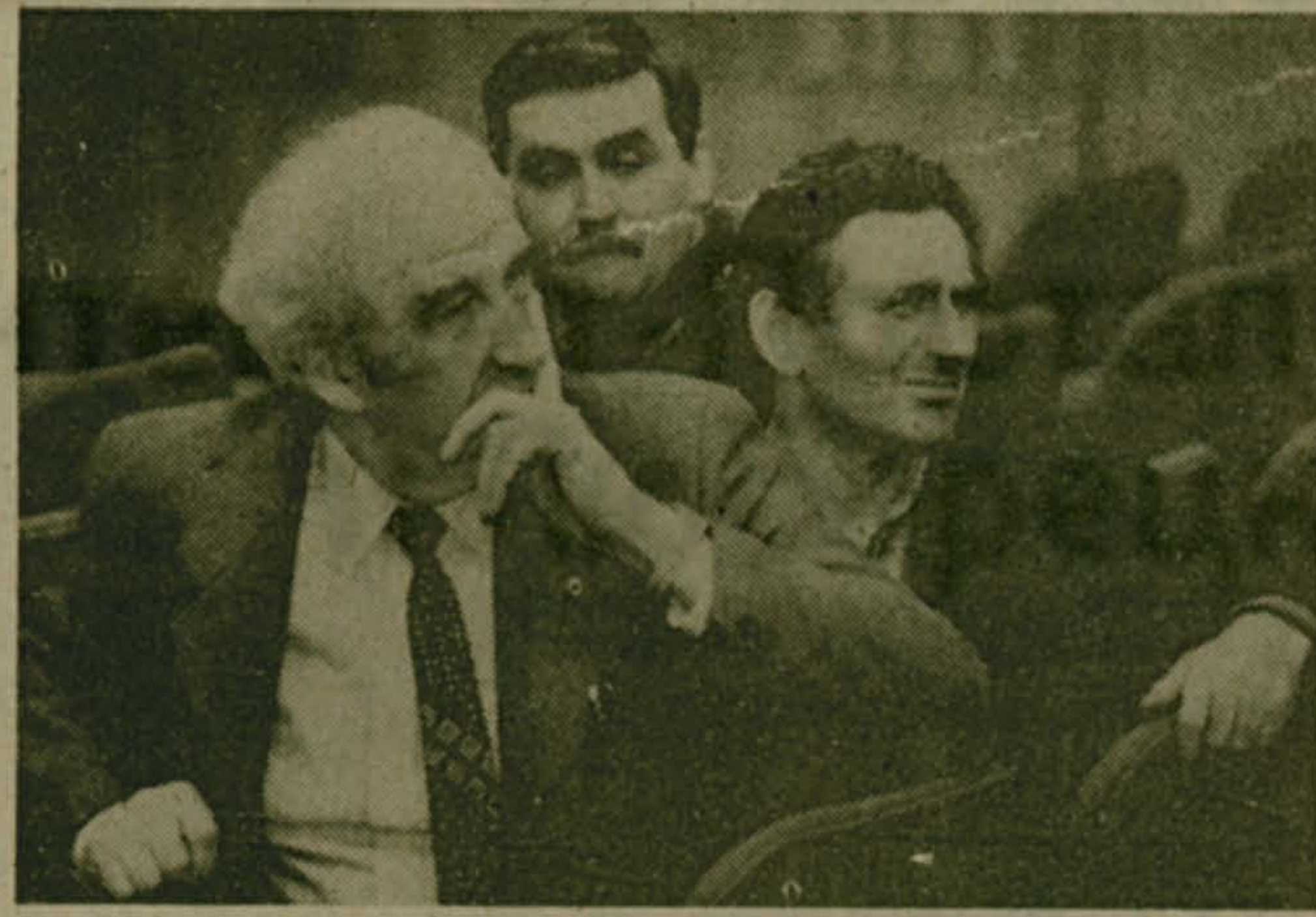
☉ Что день грядущий нам готовит?..