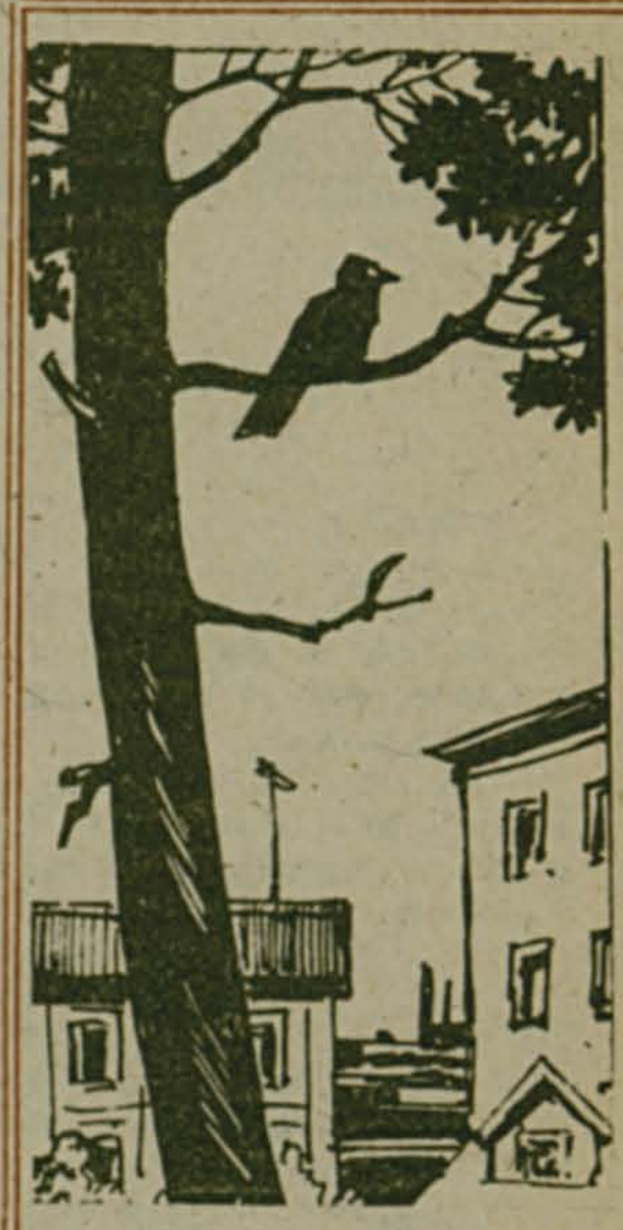
Рисунок Виктора Кунташева.