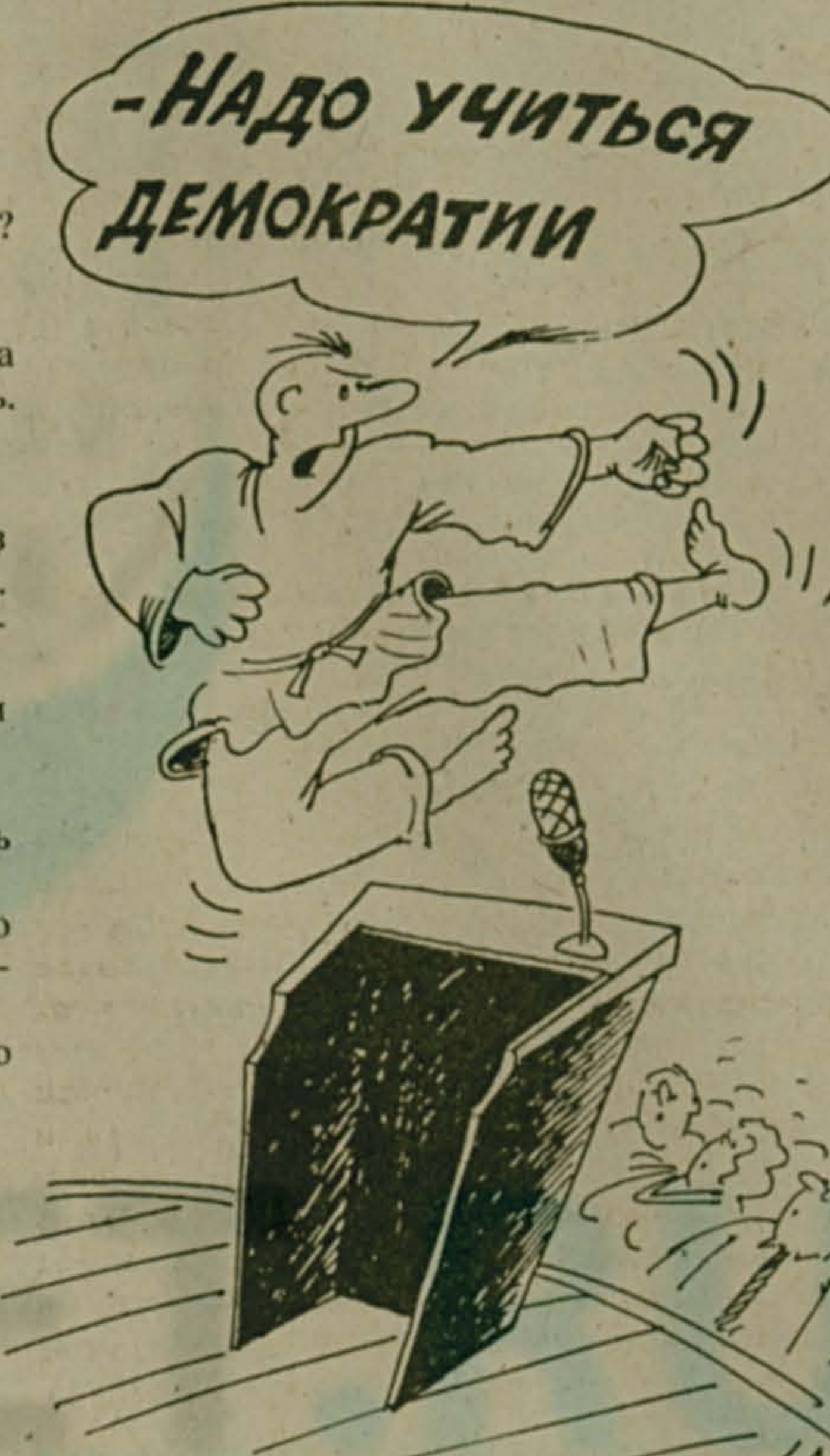
Рис. Александра УМЯРОВА.

Так мы и договорились. Но только я уже не пью. На муки жены посмотрелся и будто себя увидел. В. ИВУШКИН.