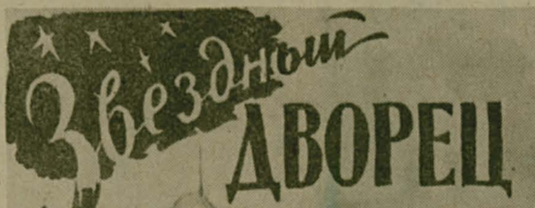
На холме — эстакада. Ярко-красная ажурная ферма удерживает ракету. Весеннее солнце делает ослепительной ее молочную белизну. По вертикали надпись: «Восток». Ракета — родная сестра, заводской дублер той, которая более четверти века назад унесла Гагарина в космос.

ван восьмимиллионный посетитель. Среди множества экспонатов, космических аппаратов, приборов — наш старый знакомый, тот самый мастерок.