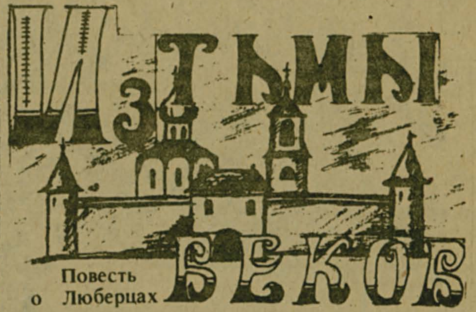
Повесть о Люберцах