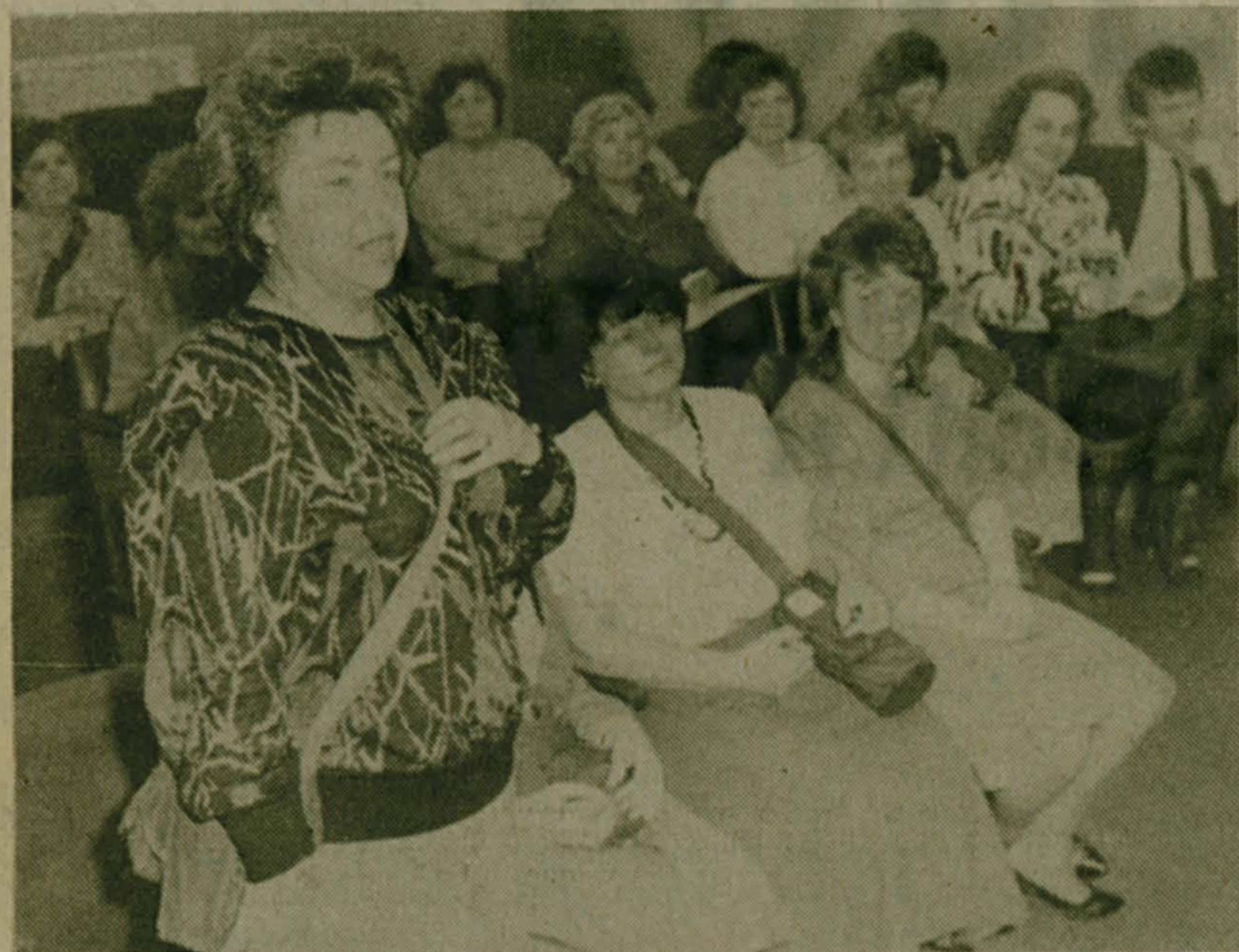
Умение само не приходит