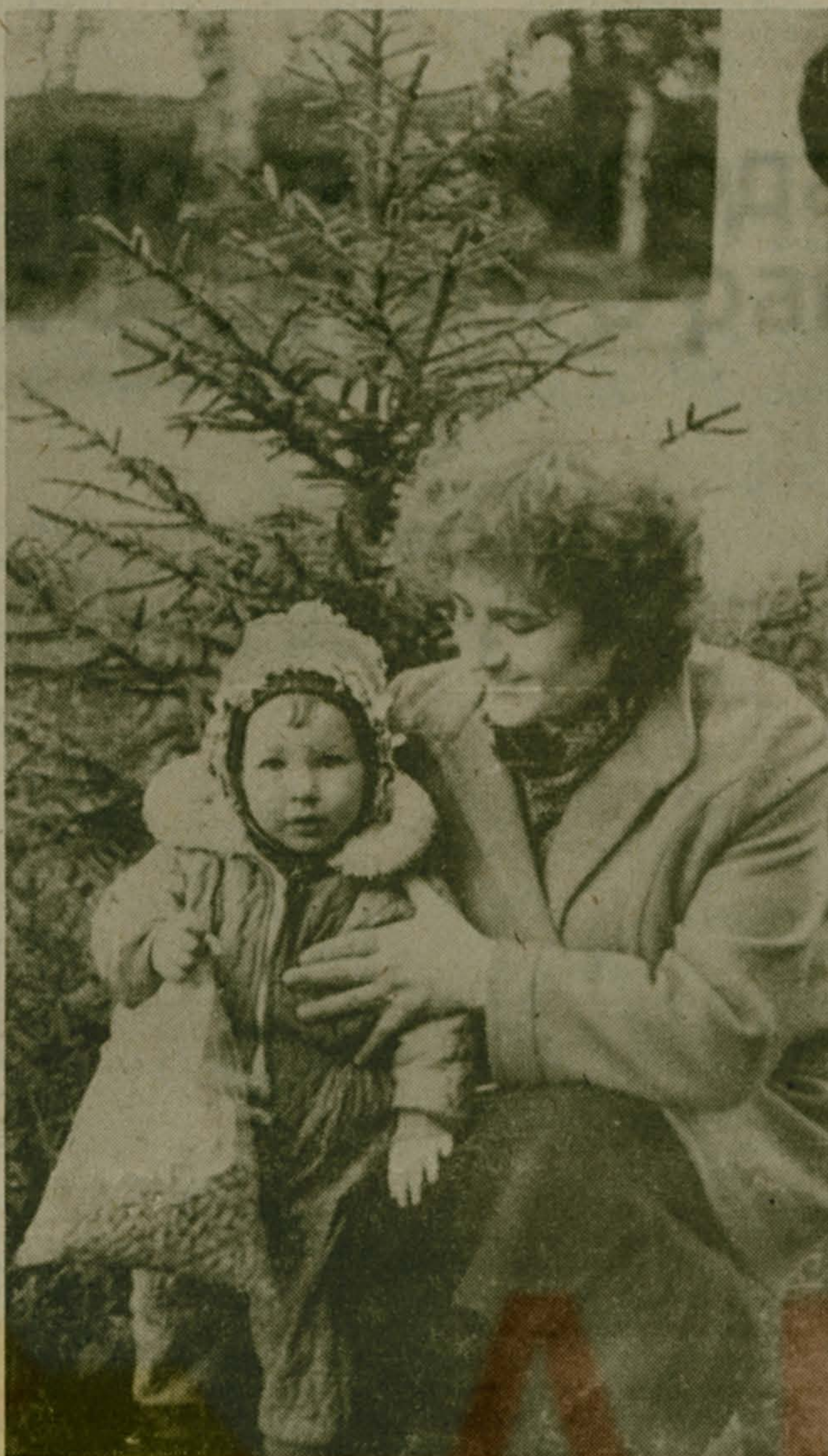
ХОРОШО С МАМОЙ!