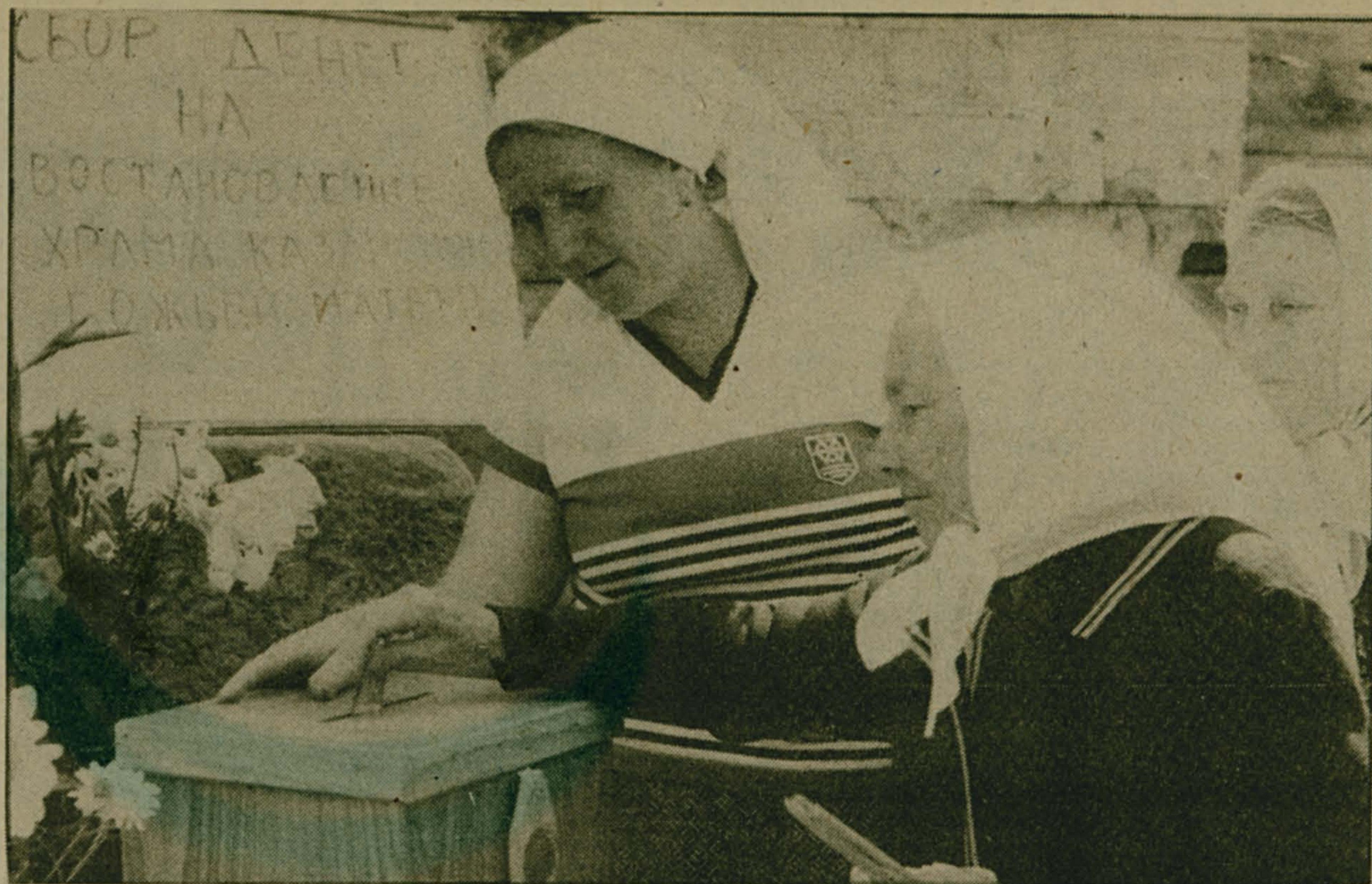
21 июня возле руин церкви Казанской Божьей Матери в Котельниках состоялся молебен. Об этом событии, церковных проблемах и трудностях возрождения храма, который на днях будет передан верующим, читайте на 3-й странице.