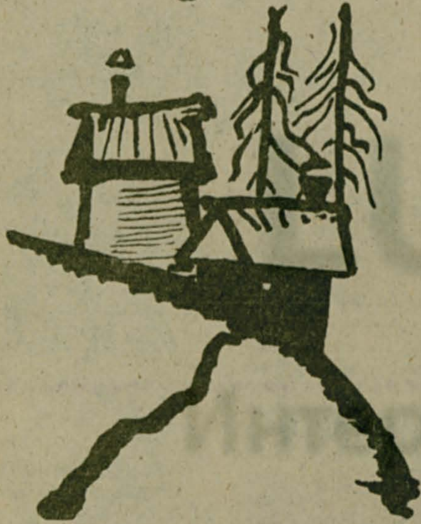
Рис. П. Василенко.

Оступился подгулявший вечер. В сумерки картофельной ботвы. Слышится в его несвязной речи Шорох трав и жадный всплеск плотвы. В запахах полыни и шалфея, Под шуршание сенозорных кос Спит он, ни о чем не сожалея, Бос, широкогруд, простволос. На охотке свежей кошенены, Обстрекавший пятки о росу, Славянин, справлявший именины, Может быть, у лешего в лесу. Сила в нем большая, не иначе. Разухабист да широк в плечах — Русый вечер, баловень удачи. Что он прячет? Сладкий мед в речах. Говорун, душеприказчик грозам. Встал, облокотился на плетень... Столбик мошкары над перевозом Обещает завтра жаркий день.