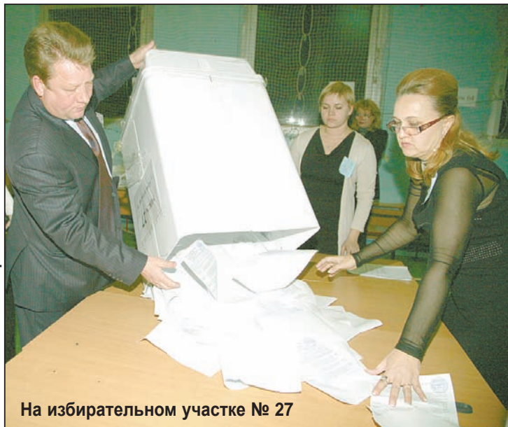
На избирательном участке № 27