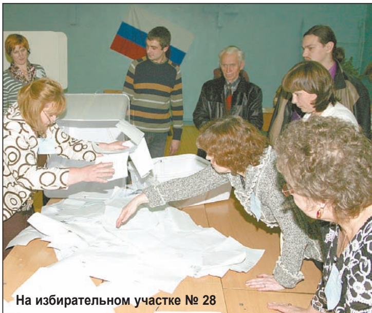
На избирательном участке № 28