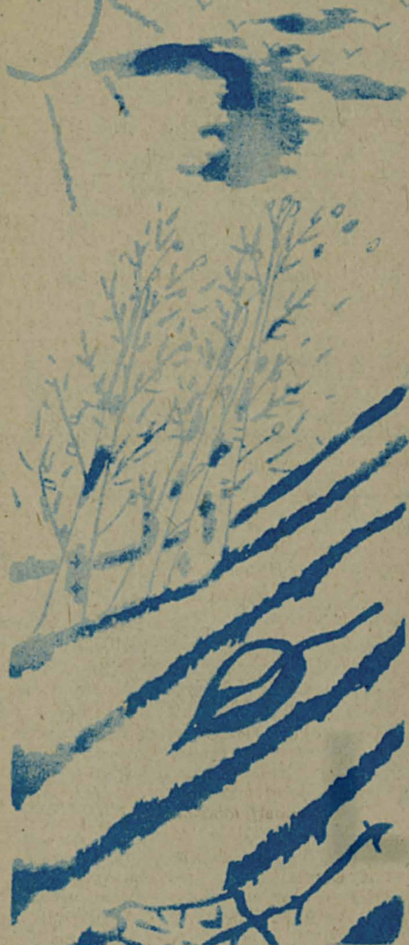
Рис. П. Василенко.