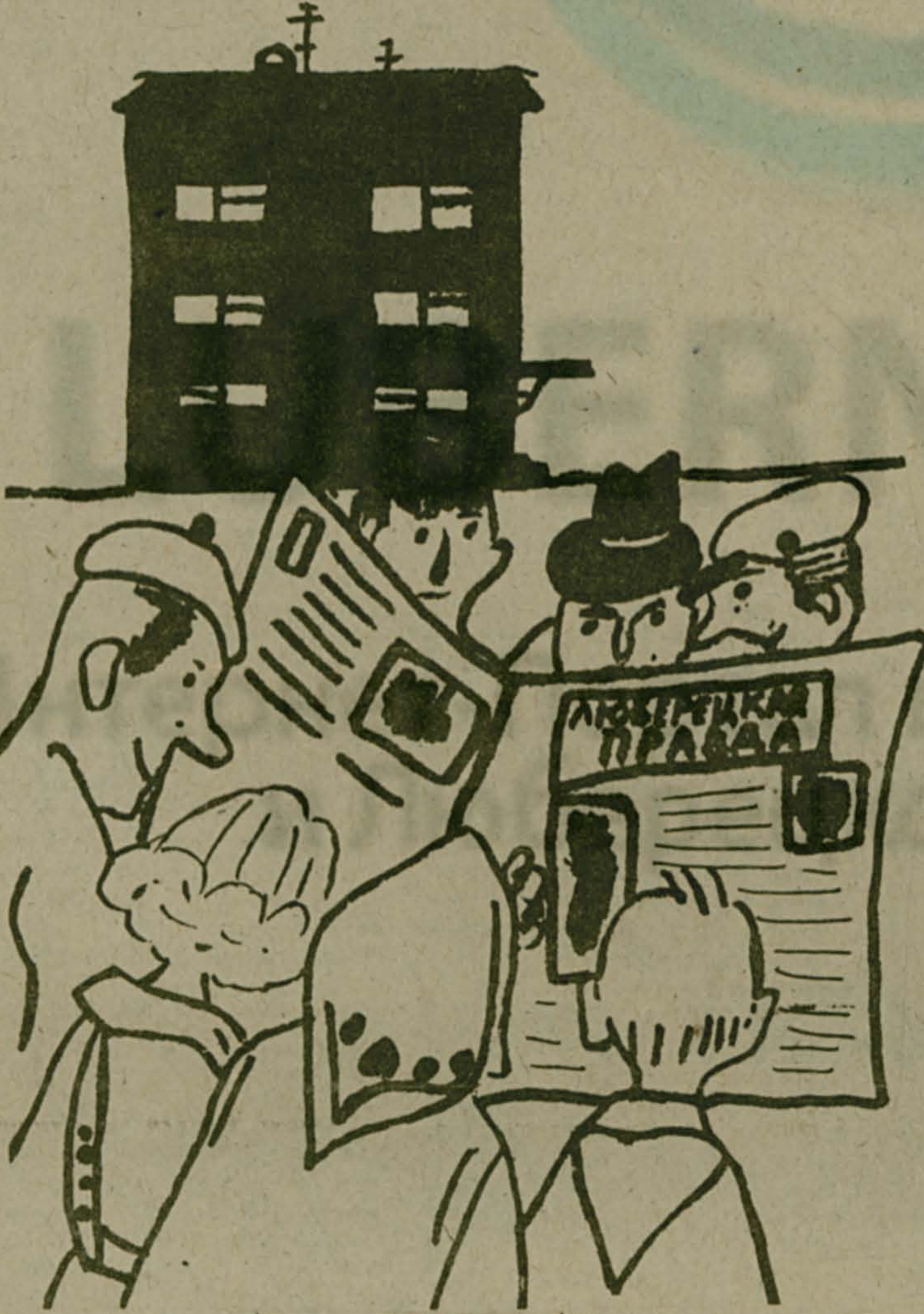
Рис. П. ВАСИЛЕНКО.