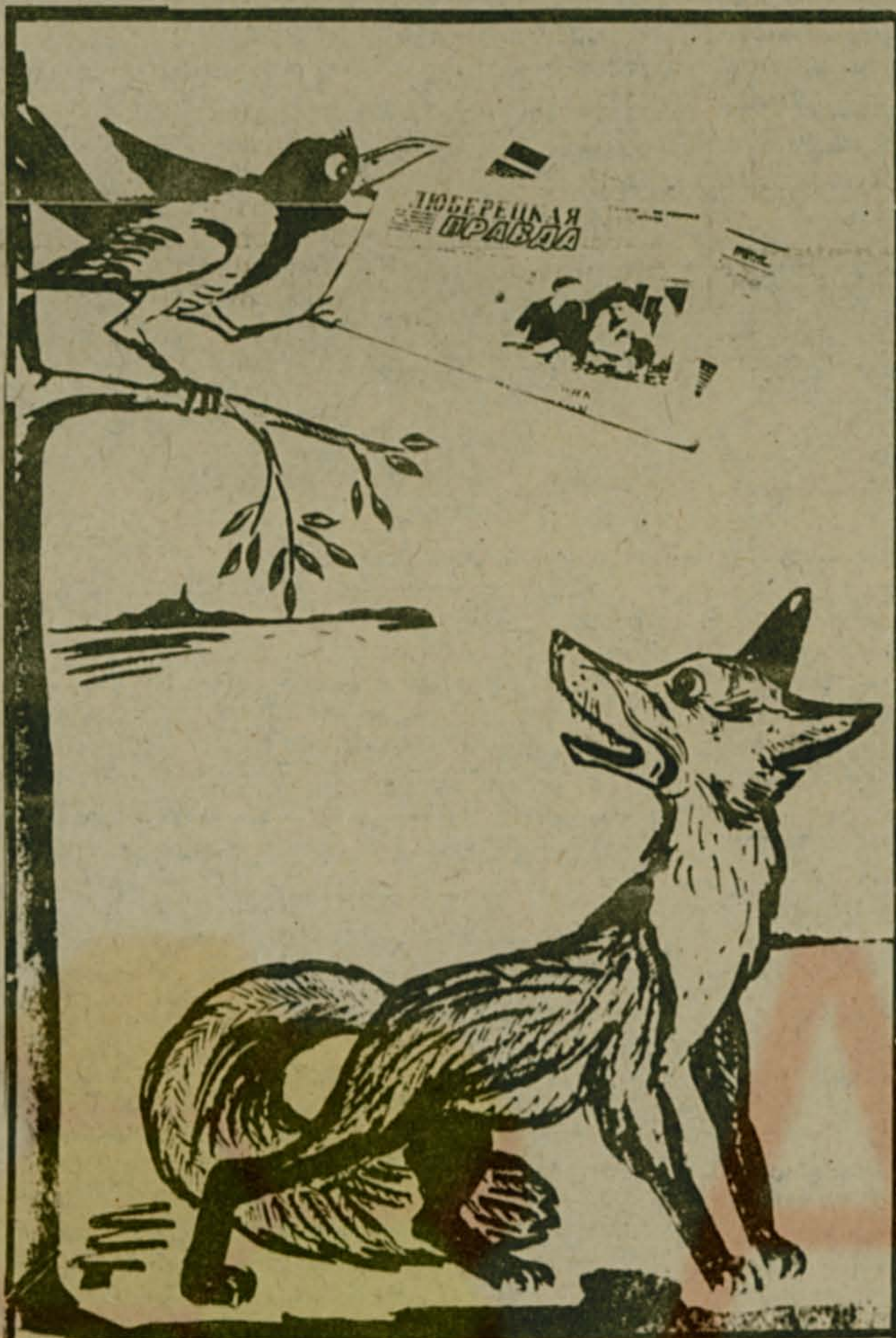
Рис. Г. ГОРШКОВА.

Напоминаем: цена подписки на год — 9 руб. 90 коп., на полгода — 4 руб. 95 коп. Индекс — 55105.