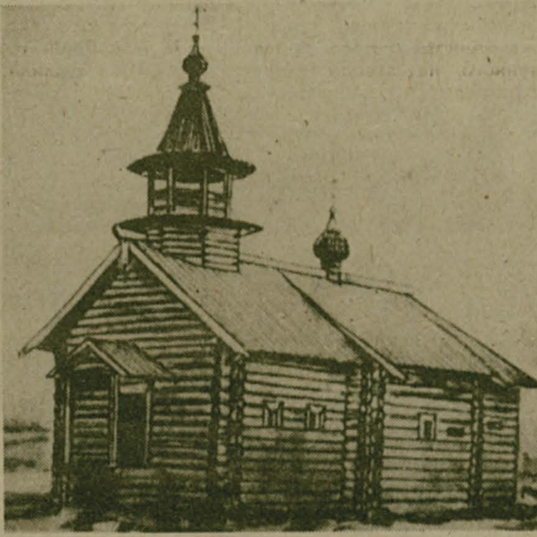
На снимке: так выглядела церковь в селе Косино в 1673 году.