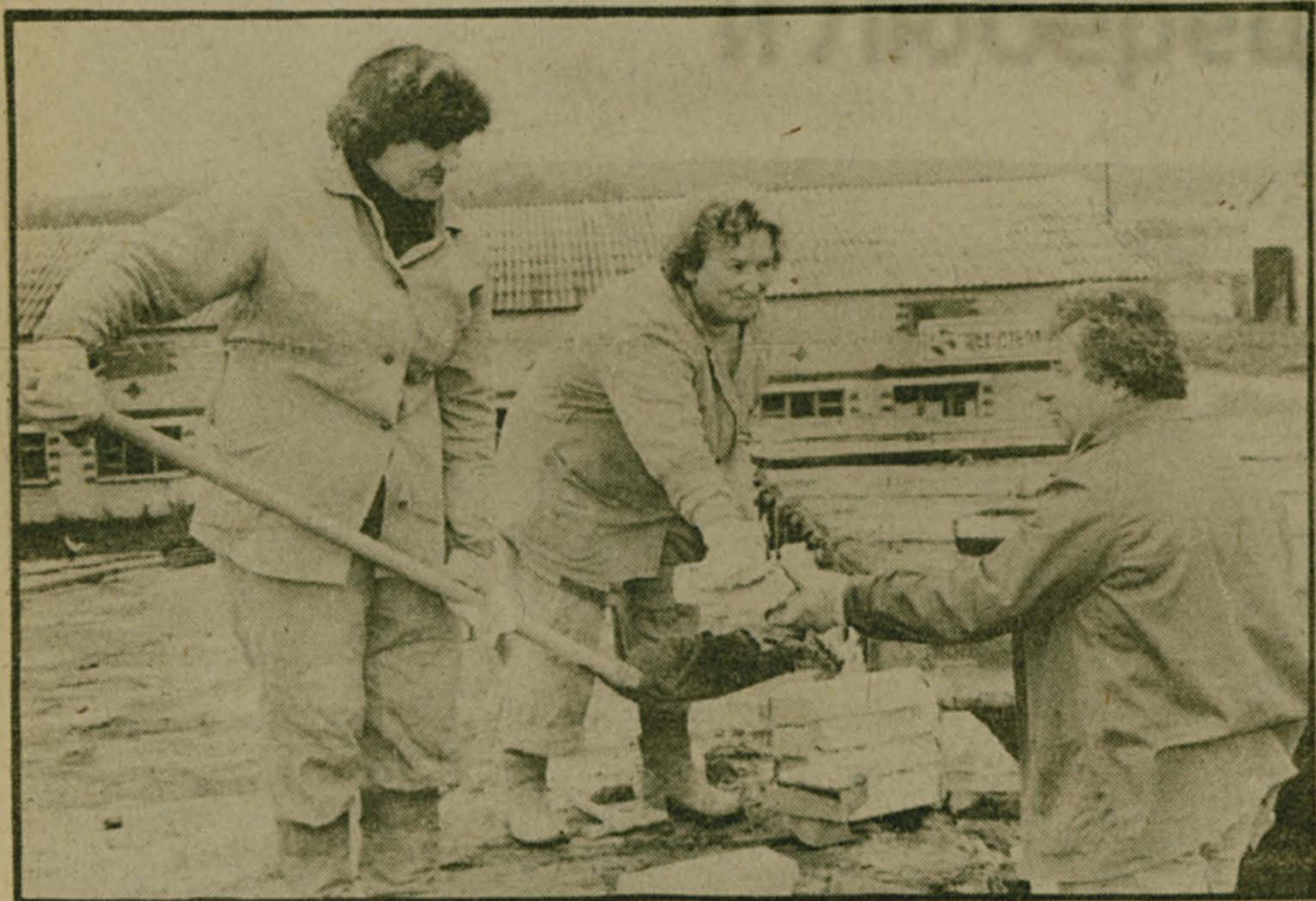
Среди животноводческих комплексов нашего района Токаревский строился одним из первых. Несмотря на это, он все время страдал, если можно так выразиться, некомплексностью: не хватало кормоцеха, нетелиного двора. Потом кормоцех построили, а нетели по-прежнему содержались на Жилинской ферме — ветхой и грязной. Наконец, в очень удобном месте, по левую сторону от цеха отелов (по правую расположен профилакторий для новорожденных телят), началось строительство нетелиного двора.

Медленно дело двигалось: то строительных материалов не хватало у госплемзавода «Петровское», то рабочих рук. Но вот здание стоит, на его крыше выполняются завершающие операции, а внутри идет монтаж технологического оборудования. Новоселье близится.