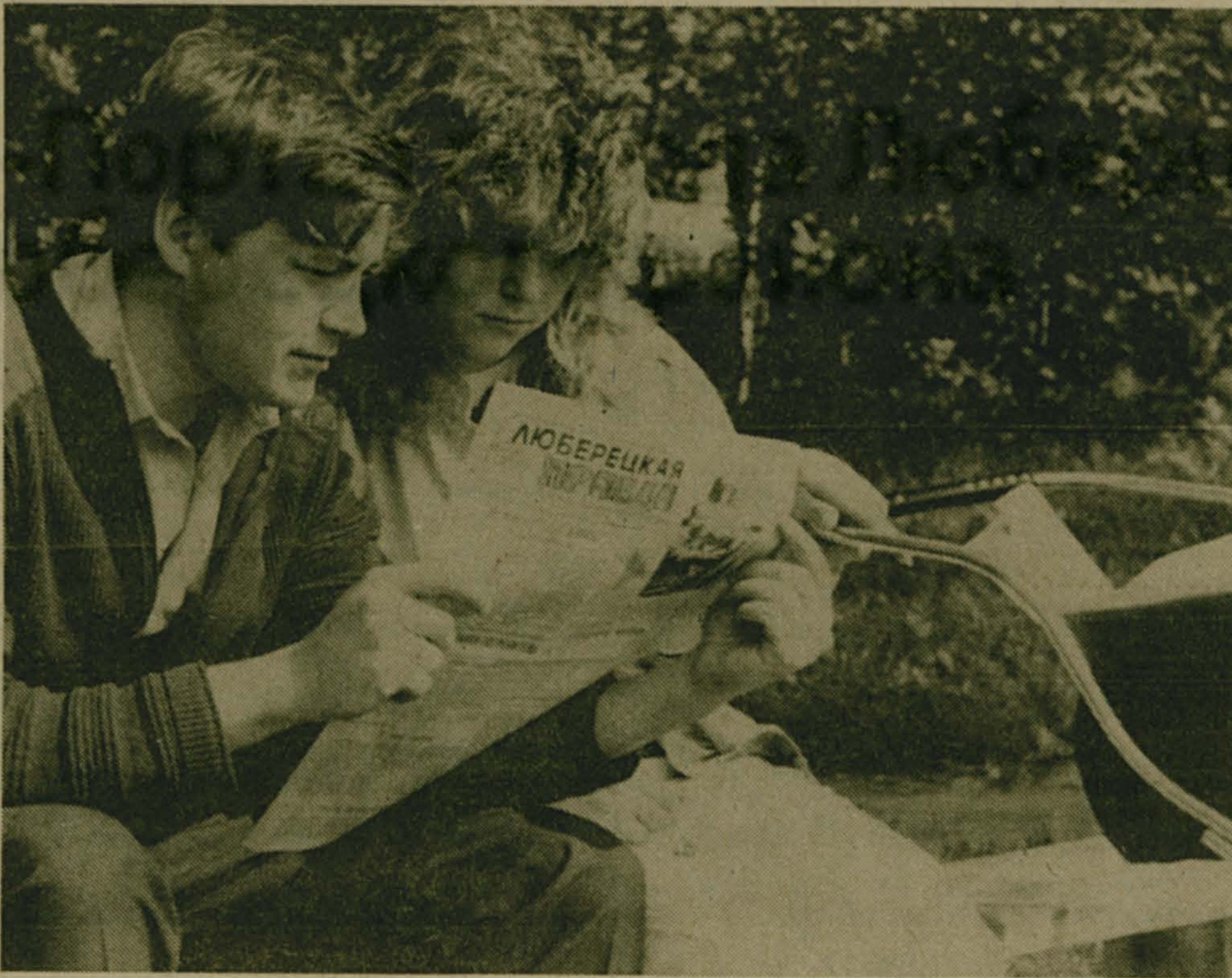
Одна на троих...

(Рекомендации разработаны специалистами европейской онкологической школы).