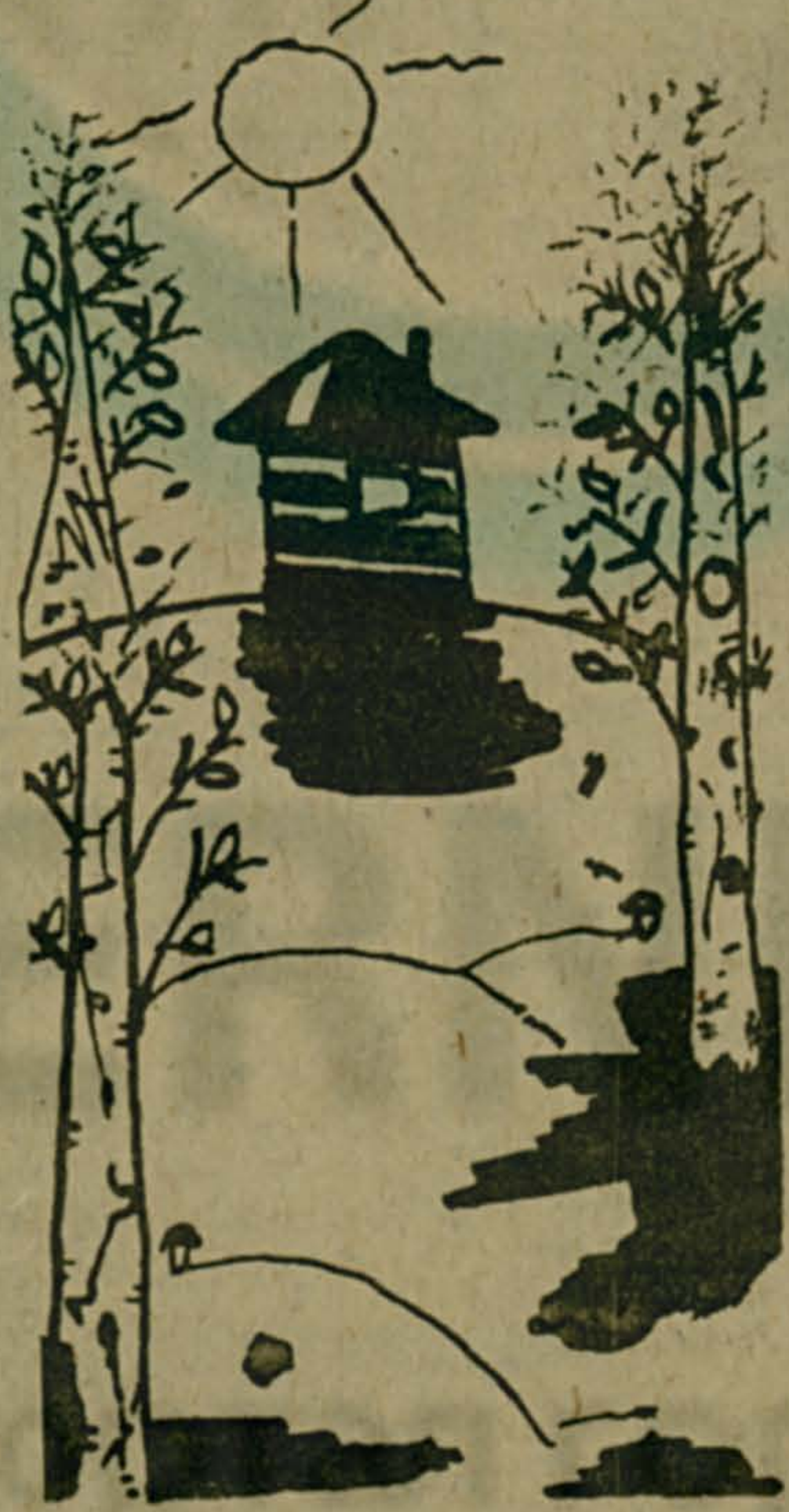
Рис. П. Василенко