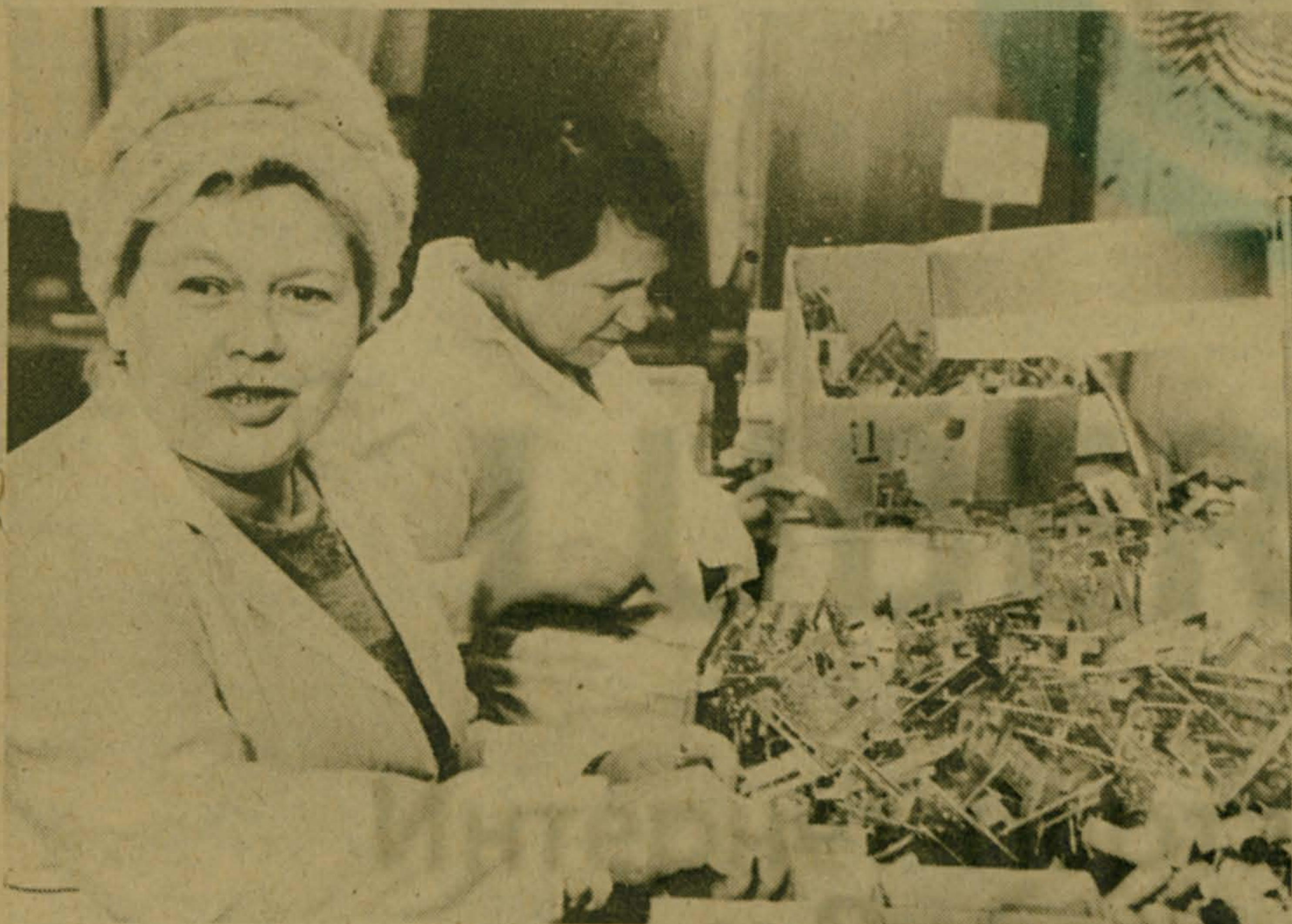
У истока конвейера

Работники заготовительного участка цеха № 1 обеспечивают работу сборочного конвейера объединения «Модуль» Всероссийского общества слепых. Это от их старания и внимательности зависит качество основных операций по выпуску готовой продукции.