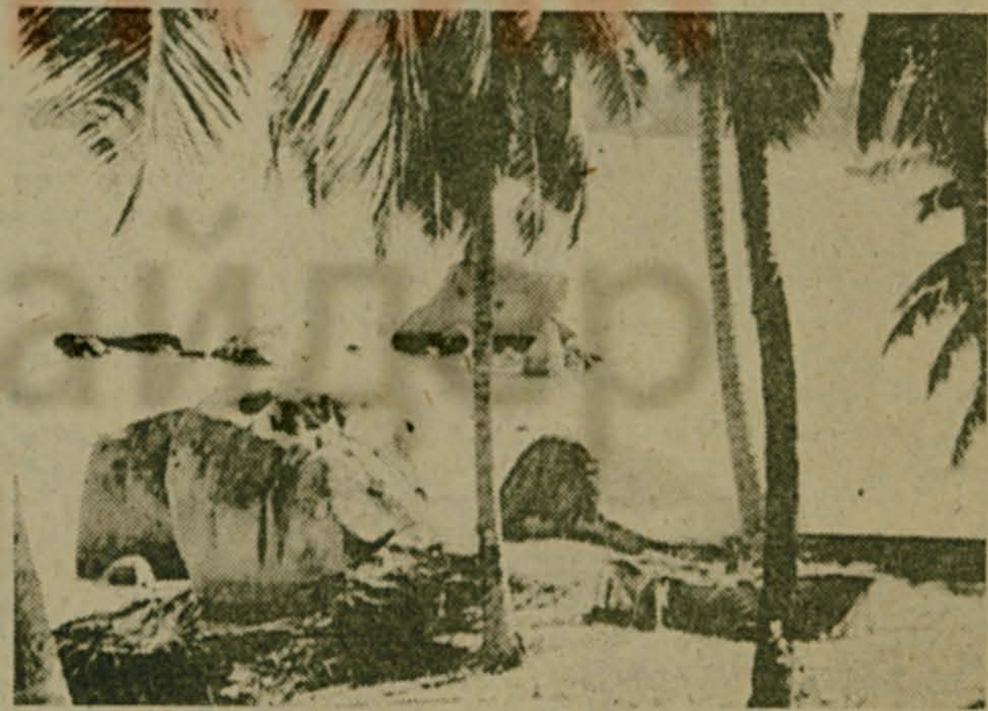
Гранит на побережье о. Маэ.