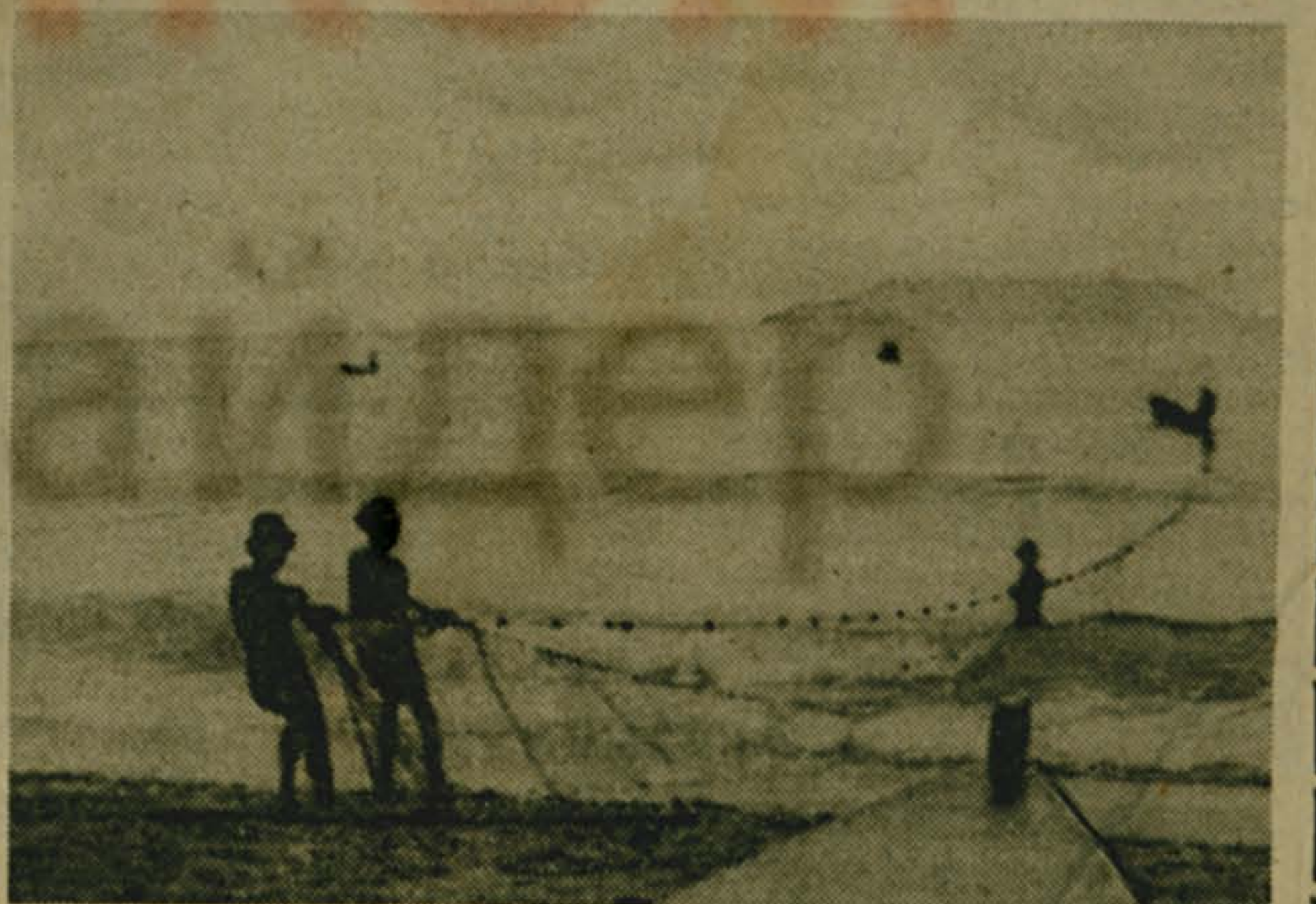
Рыбаки в бухте Бю-Валлон.