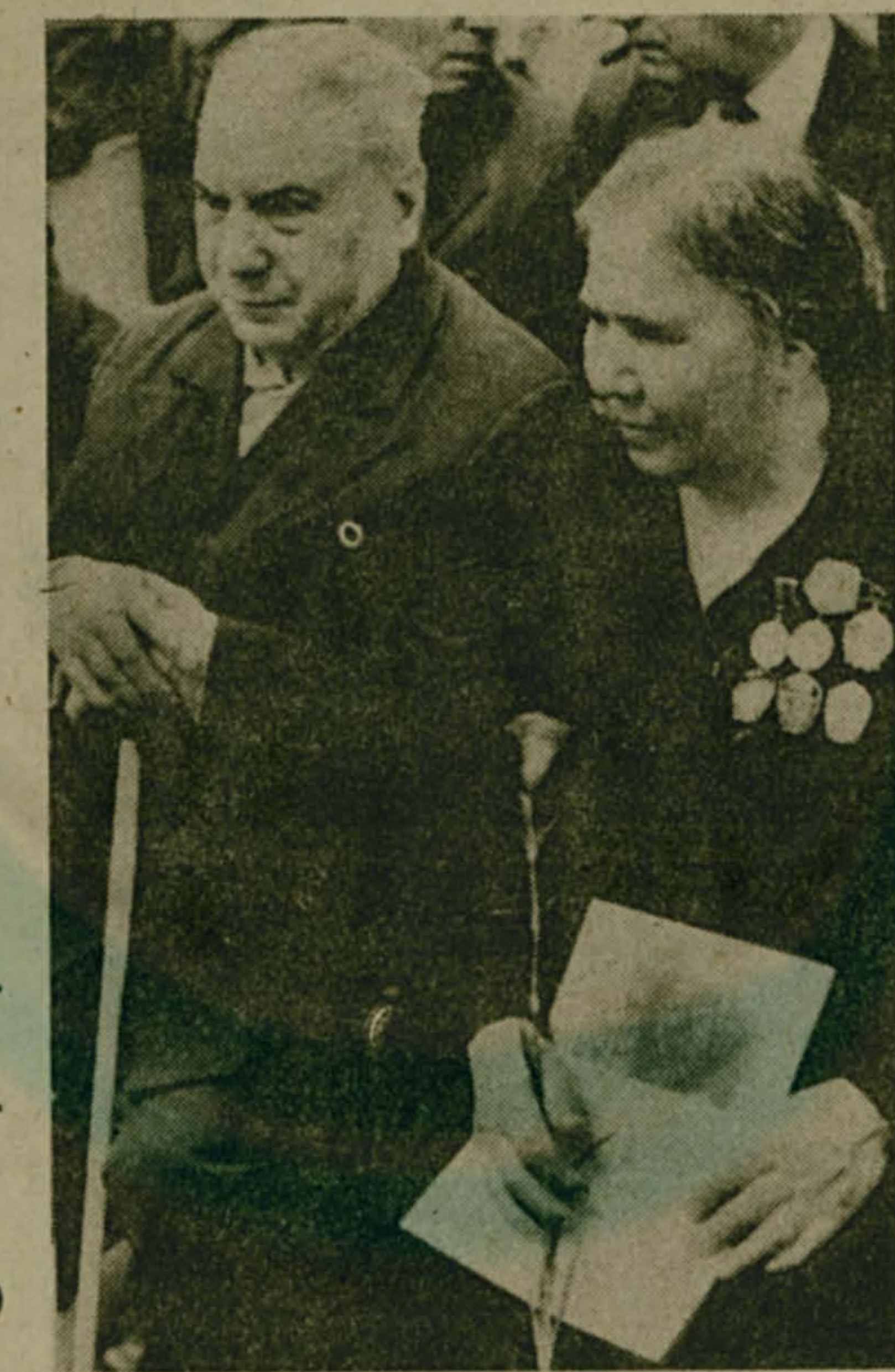
На снимках: мгновения праздника.