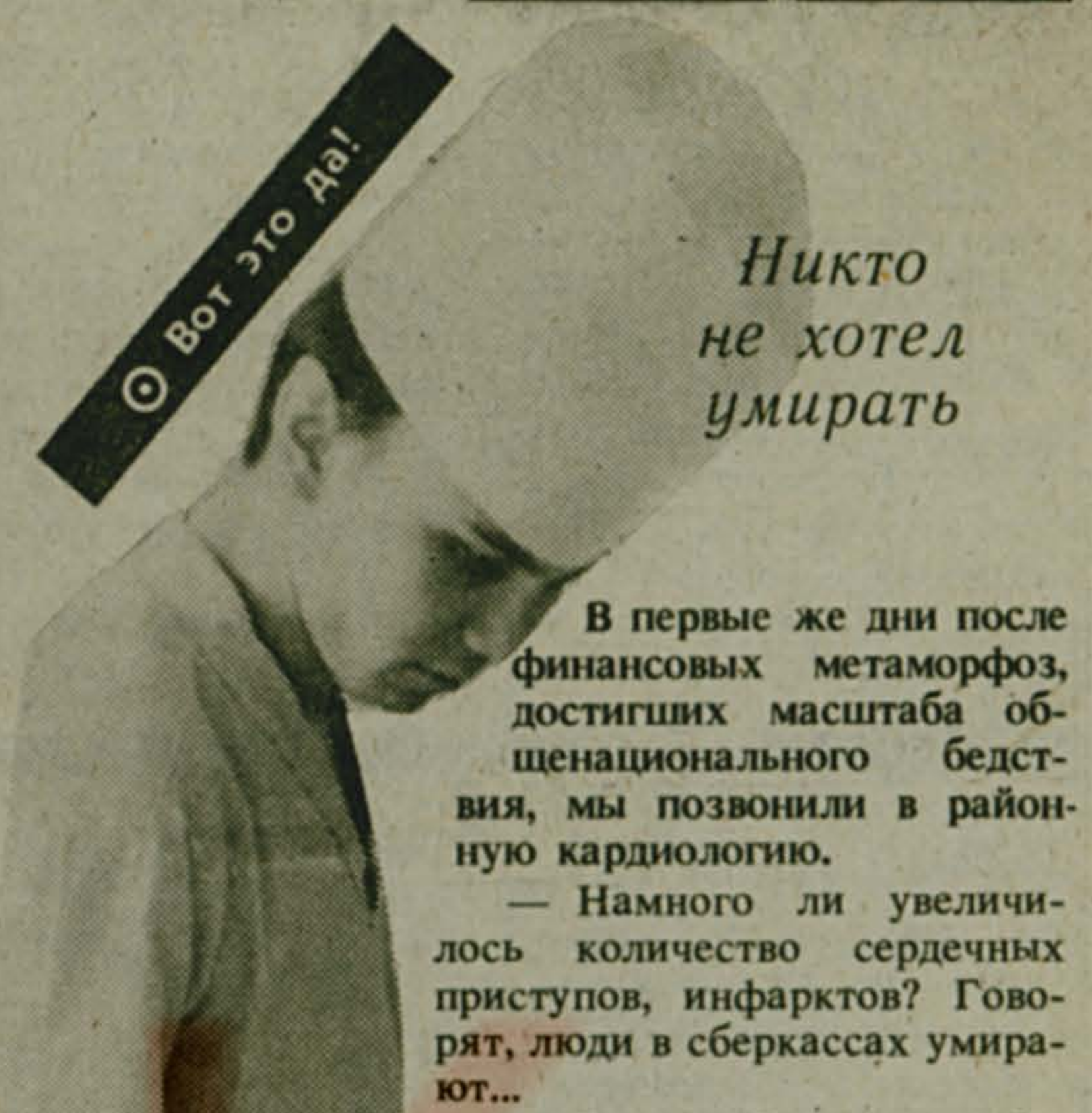
Никто не хотел умирать

В первые же дни после финансовых метаморфоз, достигших масштаба общенационального бедствия, мы позвонили в районную кардиологию.