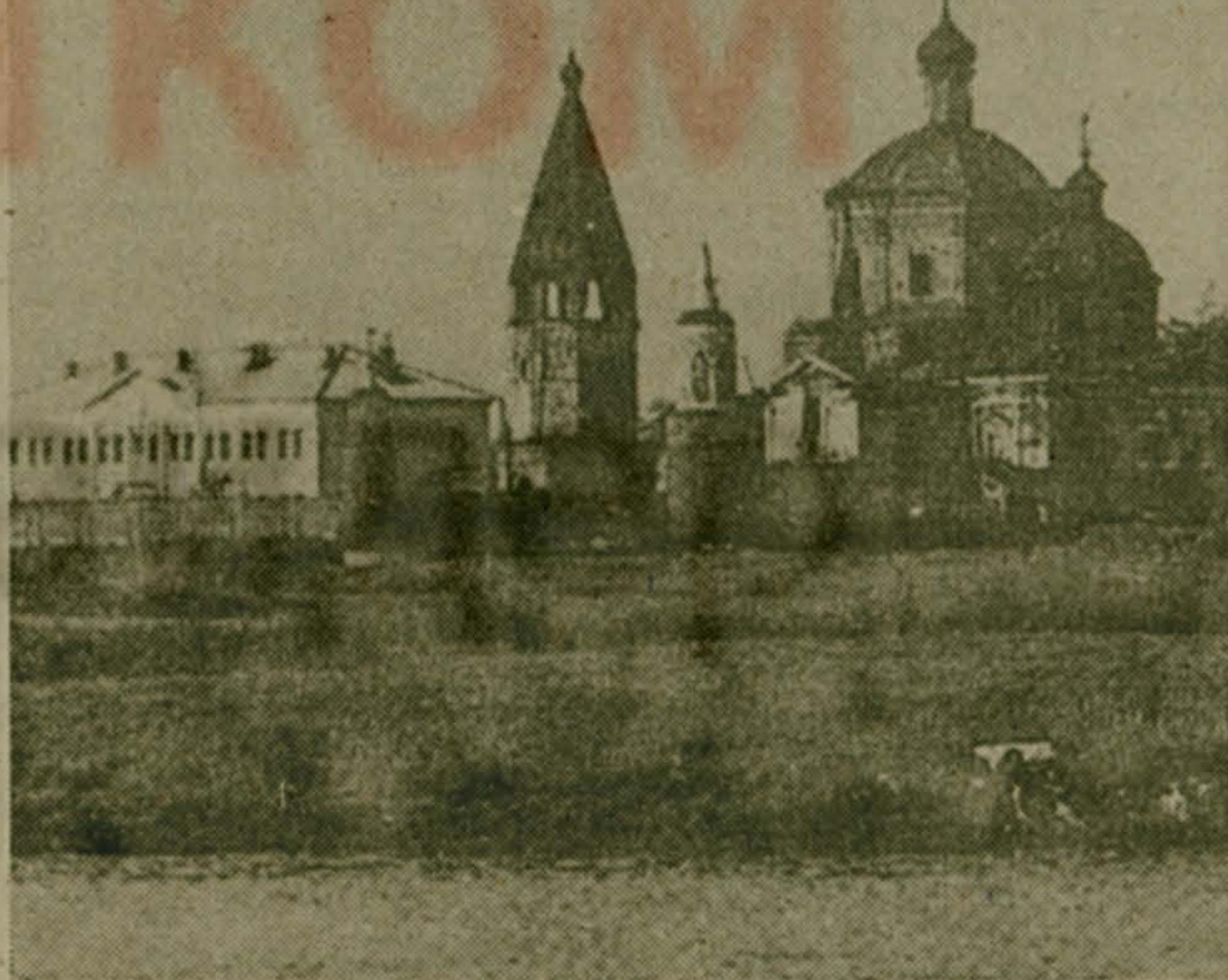
На снимке: ансамбль Бобриневского монастыря в Коломне.