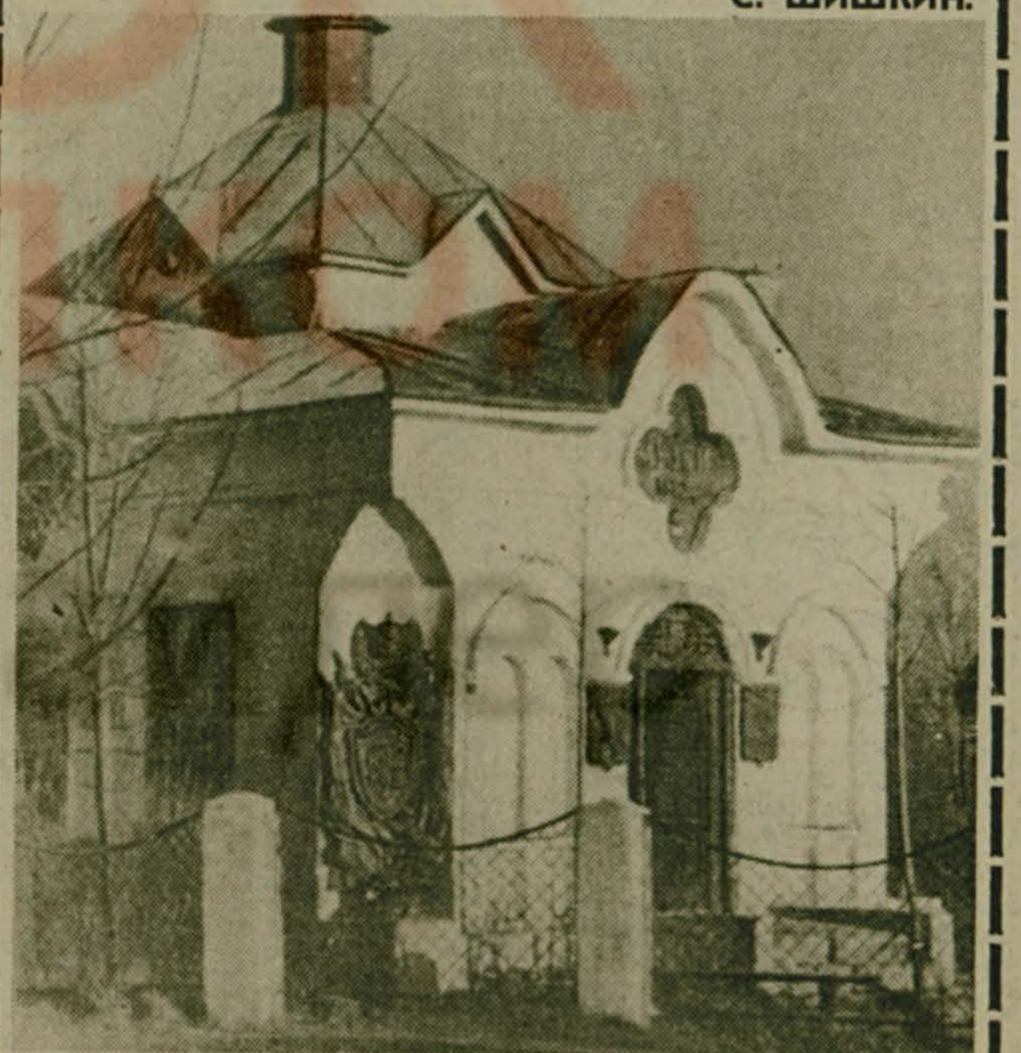
На снимках: памятник героям войны 1812 г. (вверху) и часовня в Малоярославце.