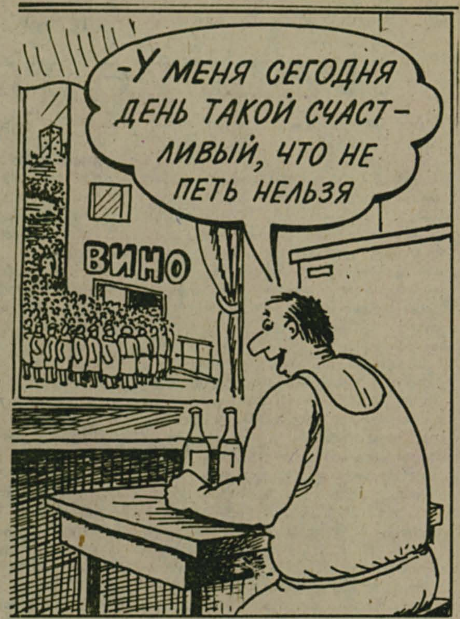
Рисунок Александра УМИРОВА.

И потому он процветает, растет повсюду потому, Что «шариков» и не хватает