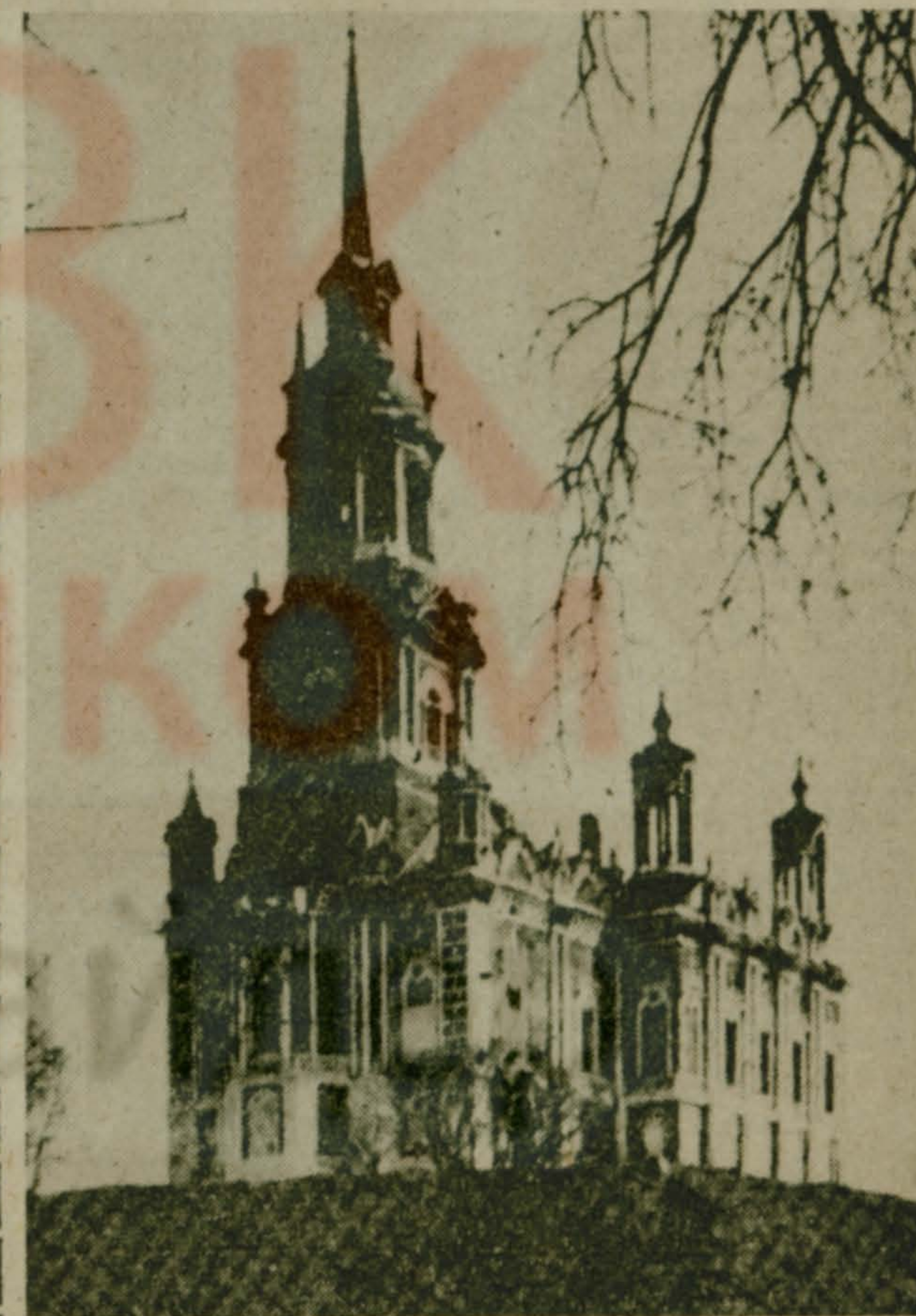
На снимке: Ново-Никольский собор.