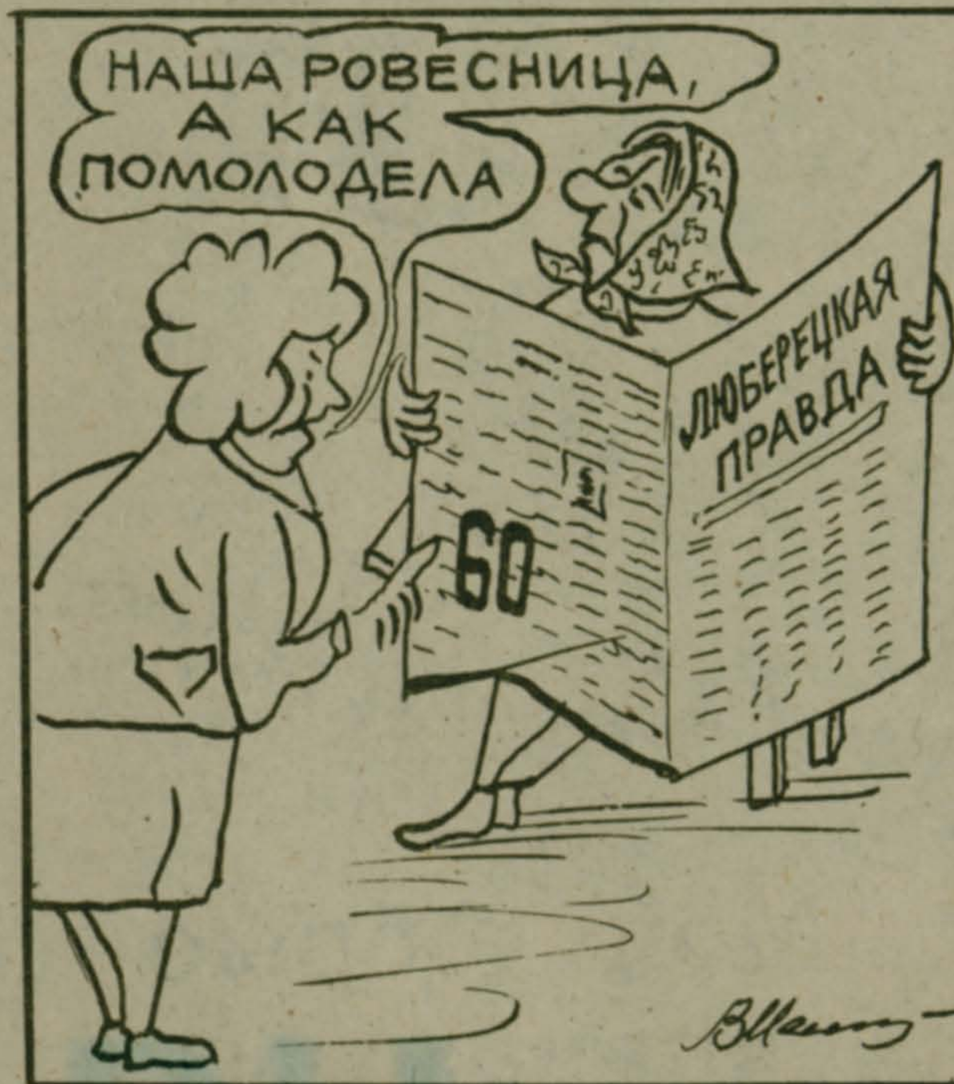
Рис. Владимира МЕЛЕШЕНКО.

— Лошадь похудела за месяц на сорок килограммов.