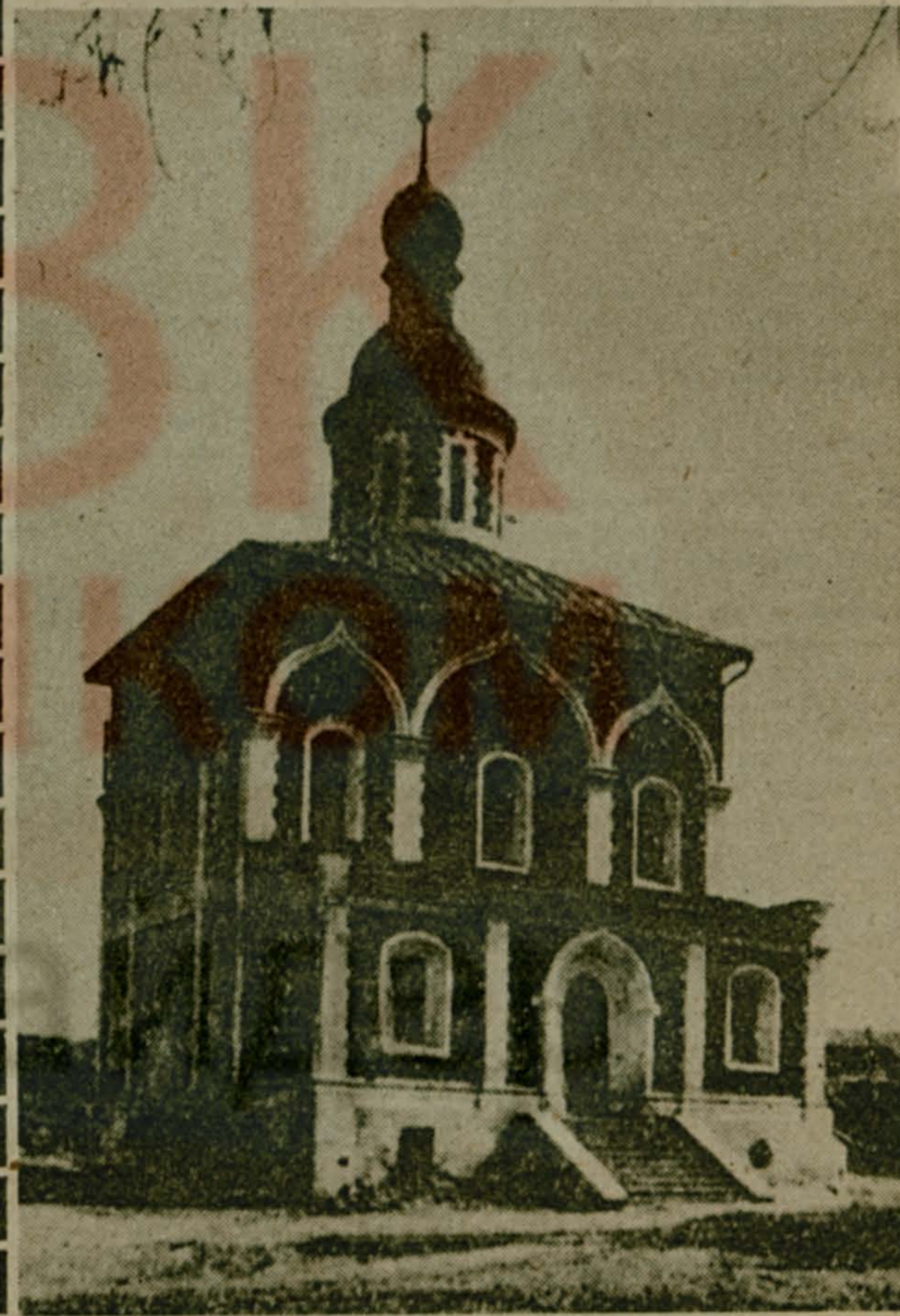
На снимке: Старо-Никольский собор в Можайске.