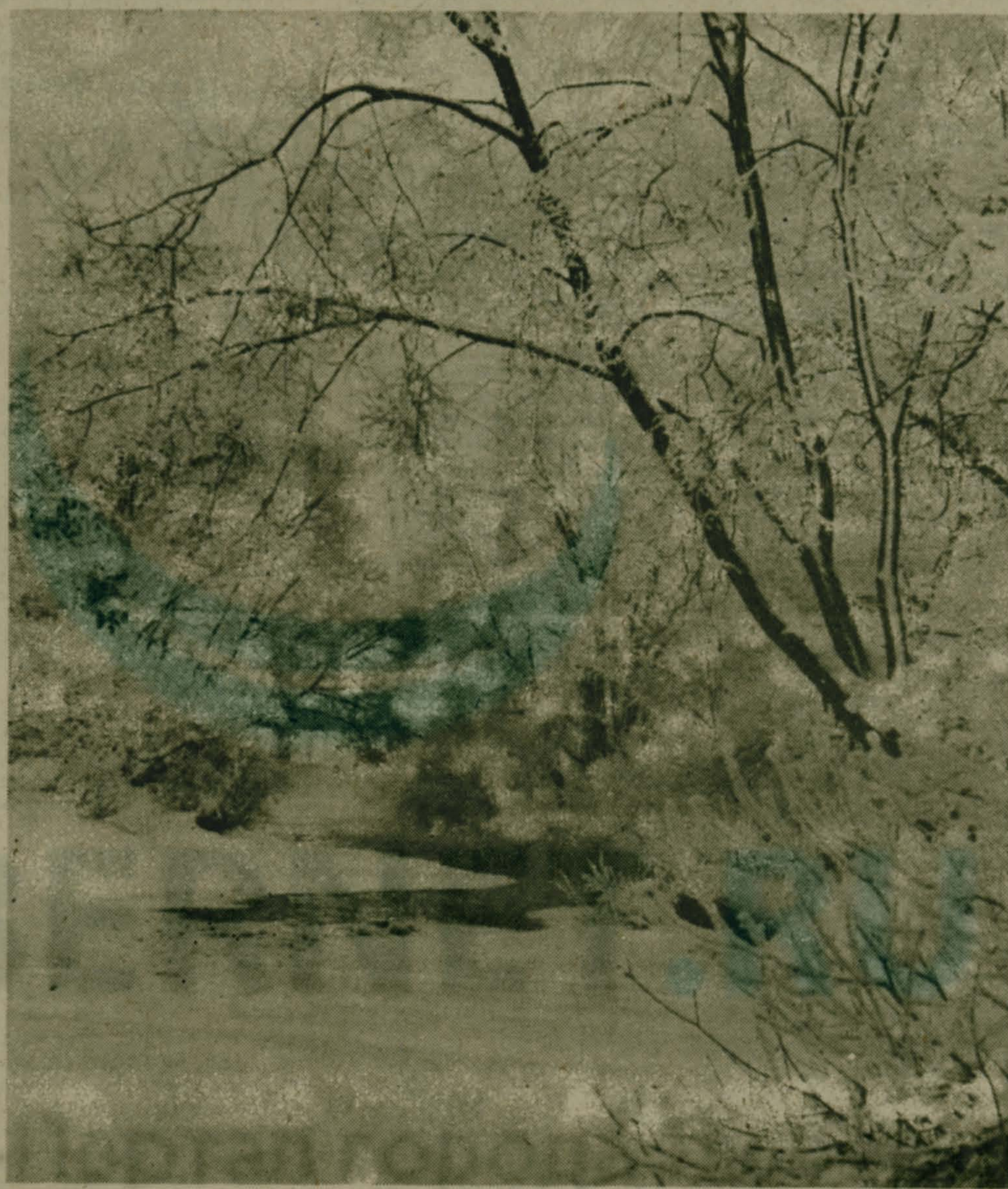
В ОЖИДАНИИ ВЕСНЫ.