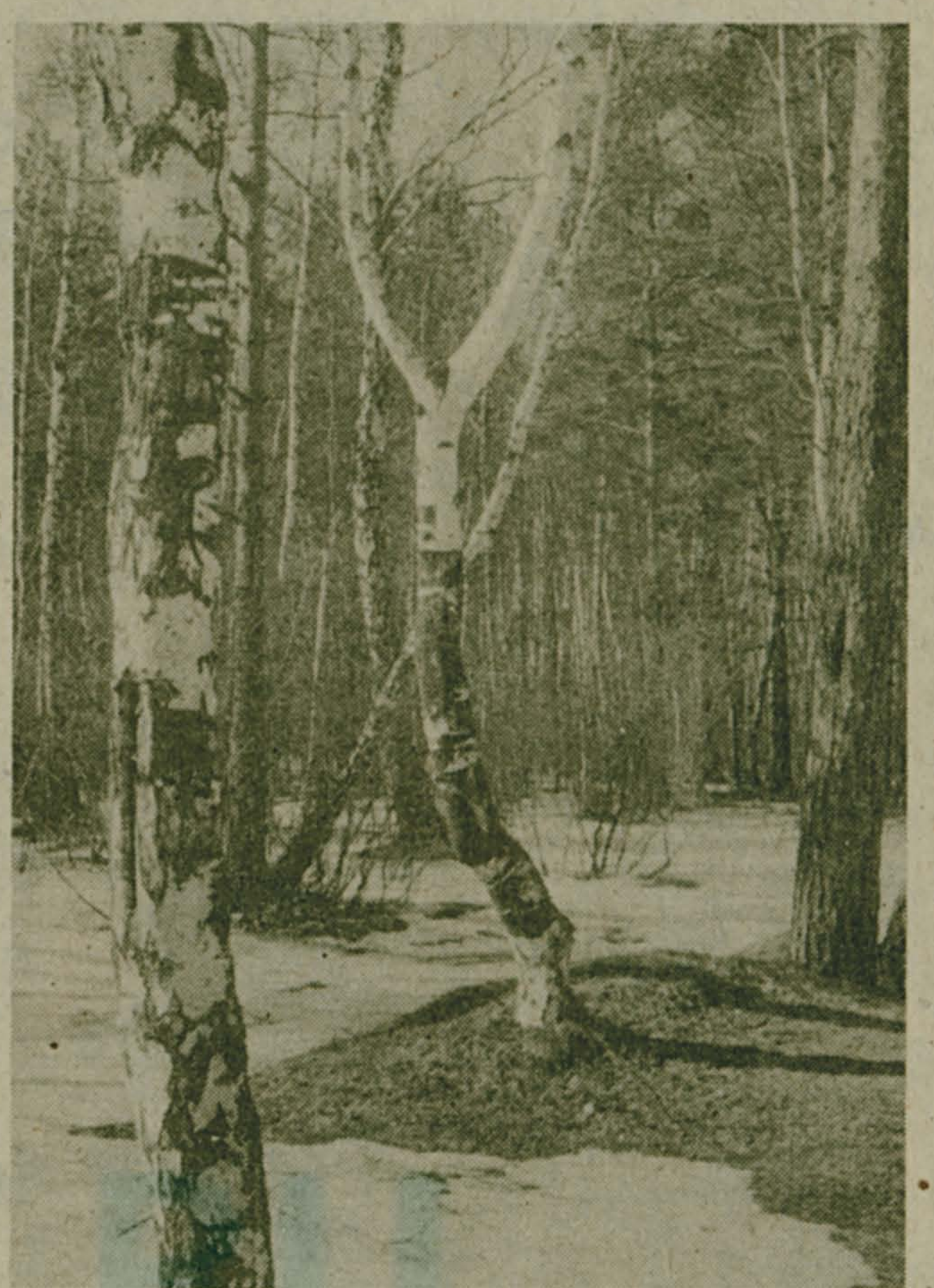
На островке весны.

Задумки пенсионерки Семеновны записала Э. ЗЕЛЕНИНА.