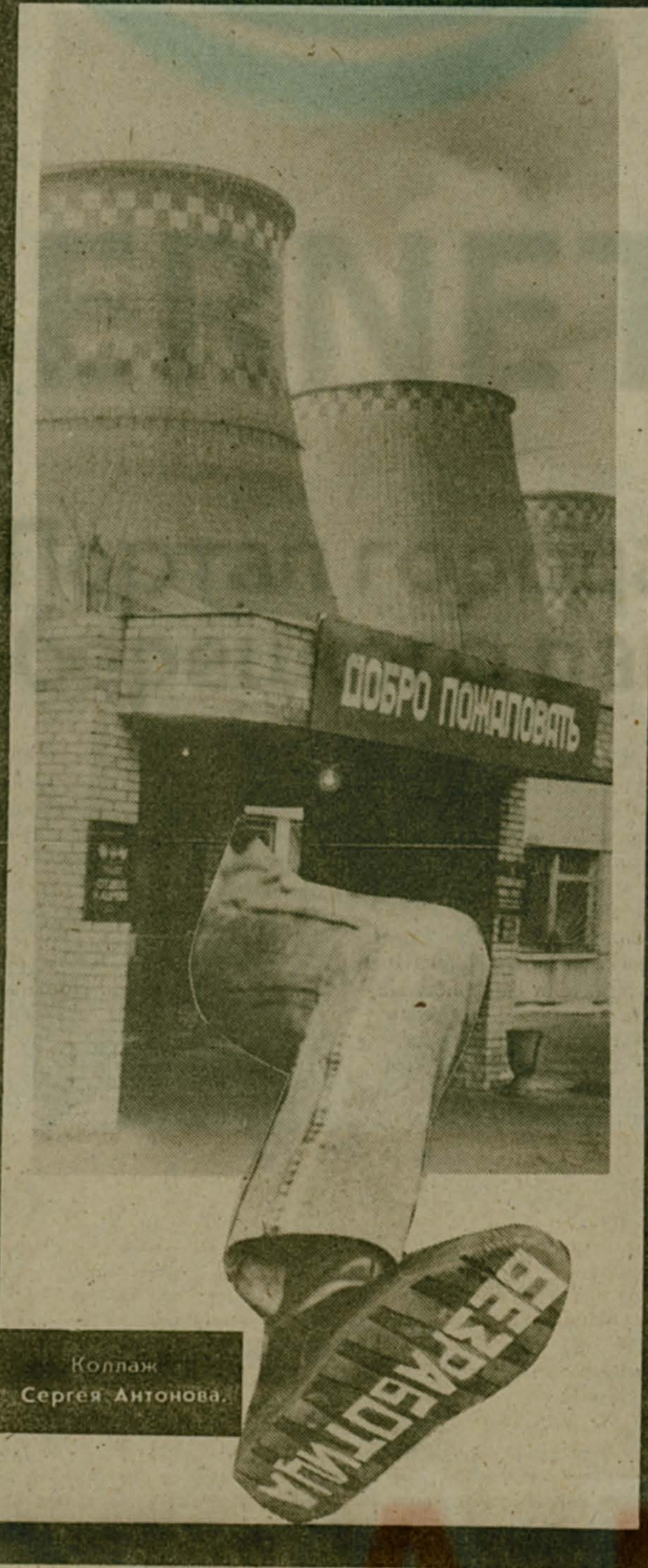
Коллаж Сергея Антонова.

5 млн. безработных. То есть без дела останется каждый тридцатый работоспособный гражданин Союза. Эта цифра гораздо меньше той, которая ожидалась экспертами год назад.