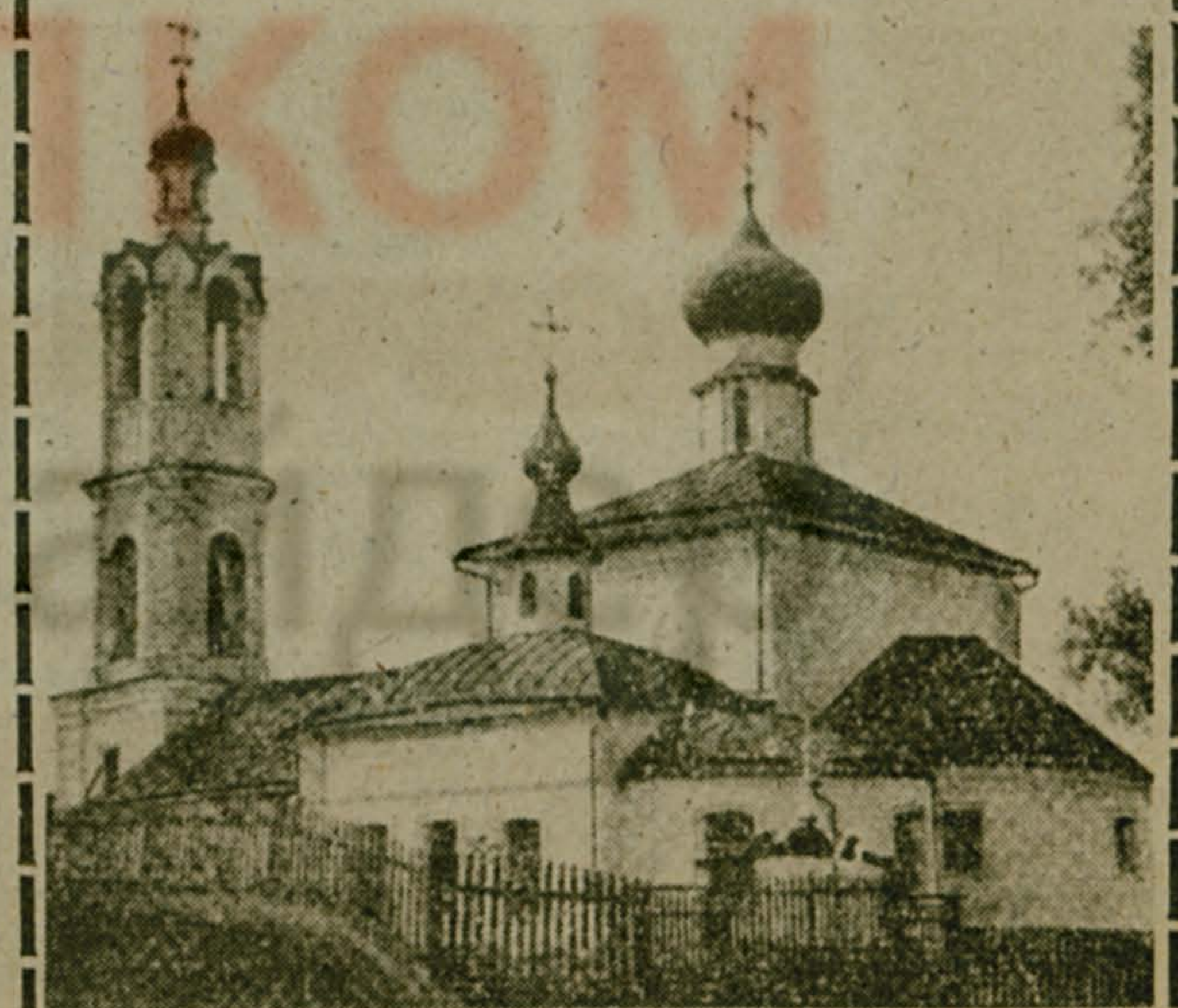
На снимке: Покровская церковь.