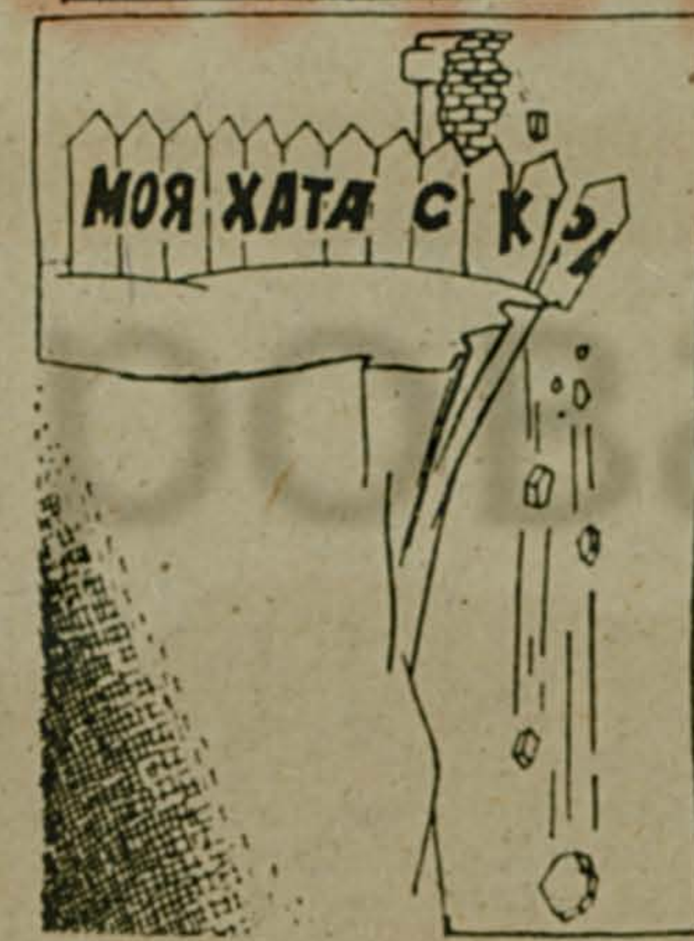
Рис. В. Любича.