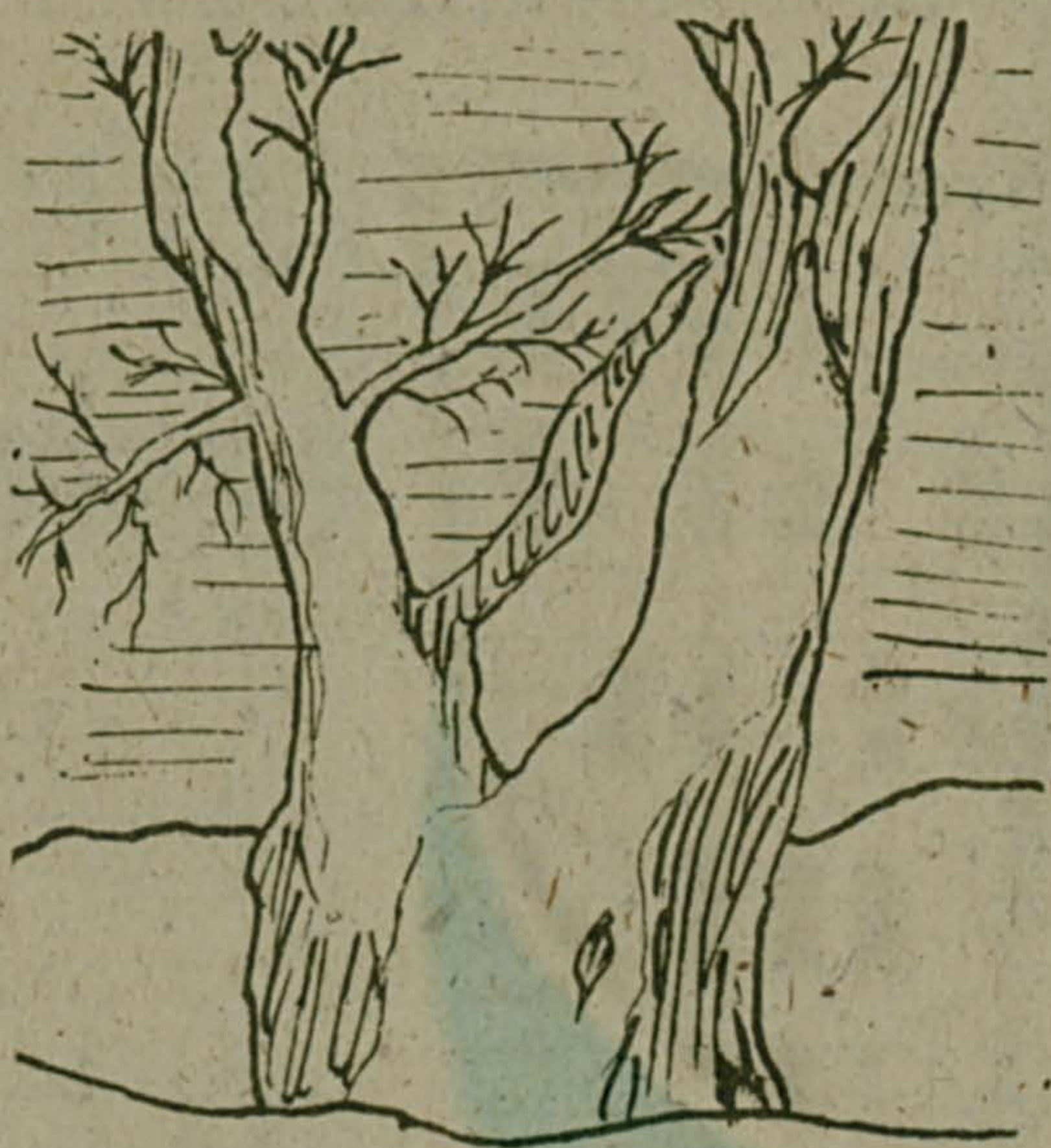
Рис. П. Василенко.