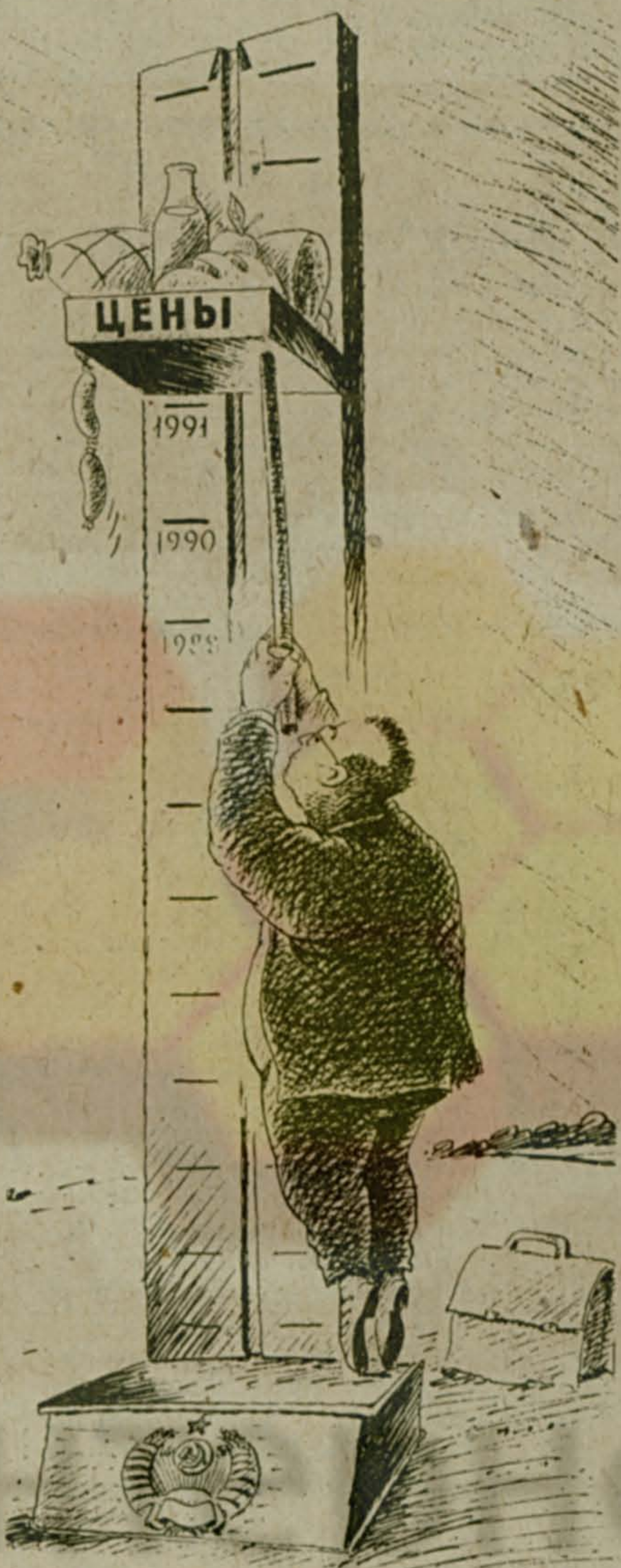
Рис. Александра Умярова.

— А как вы решаете вопрос с денежной компенсацией в связи с повы-