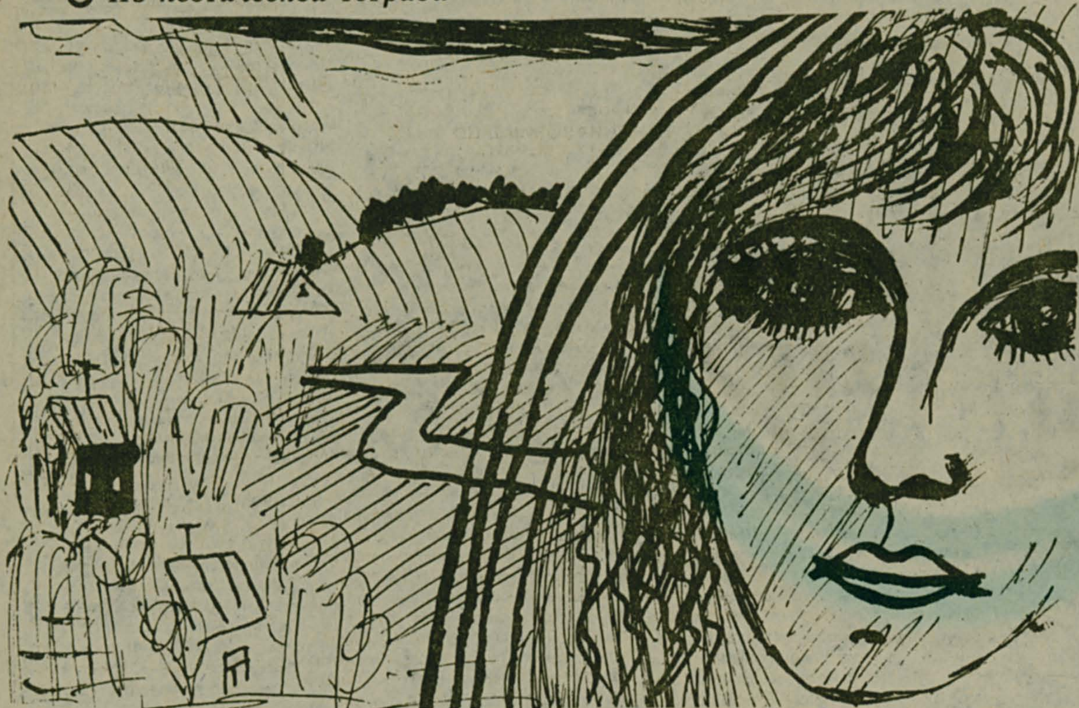
Рис. Петра ВАСИЛЕНКО.