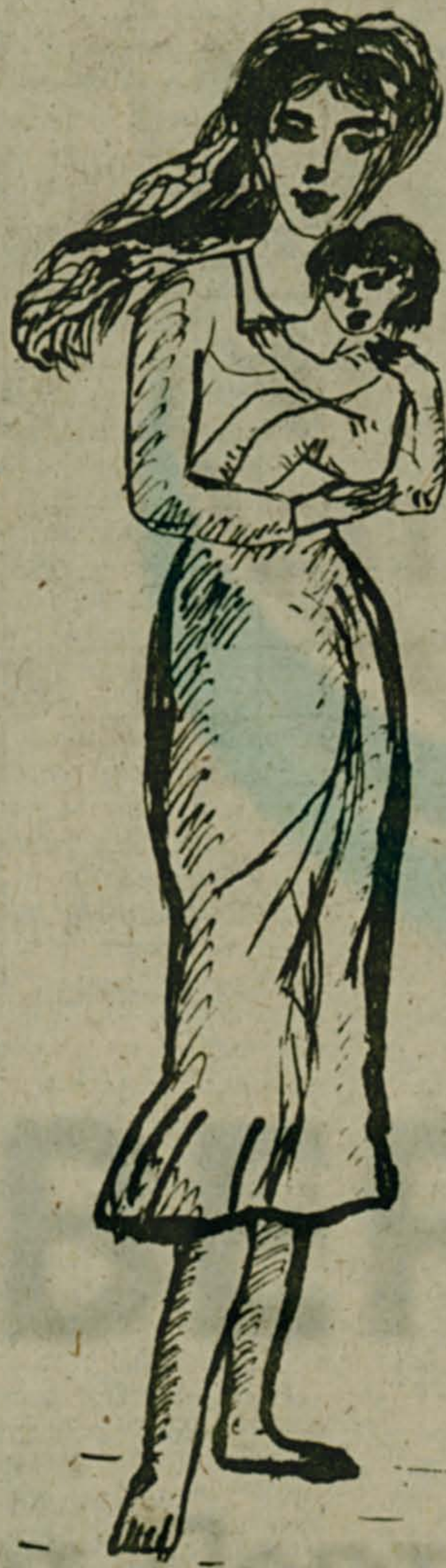
Рис. Петра ВАСИЛЕНКО.