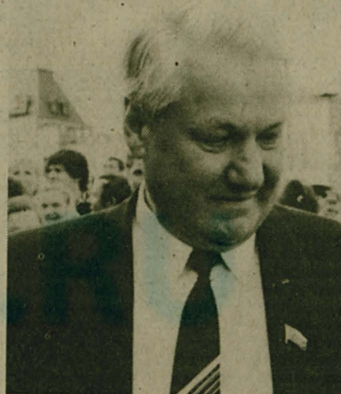
Люберчане в Москве