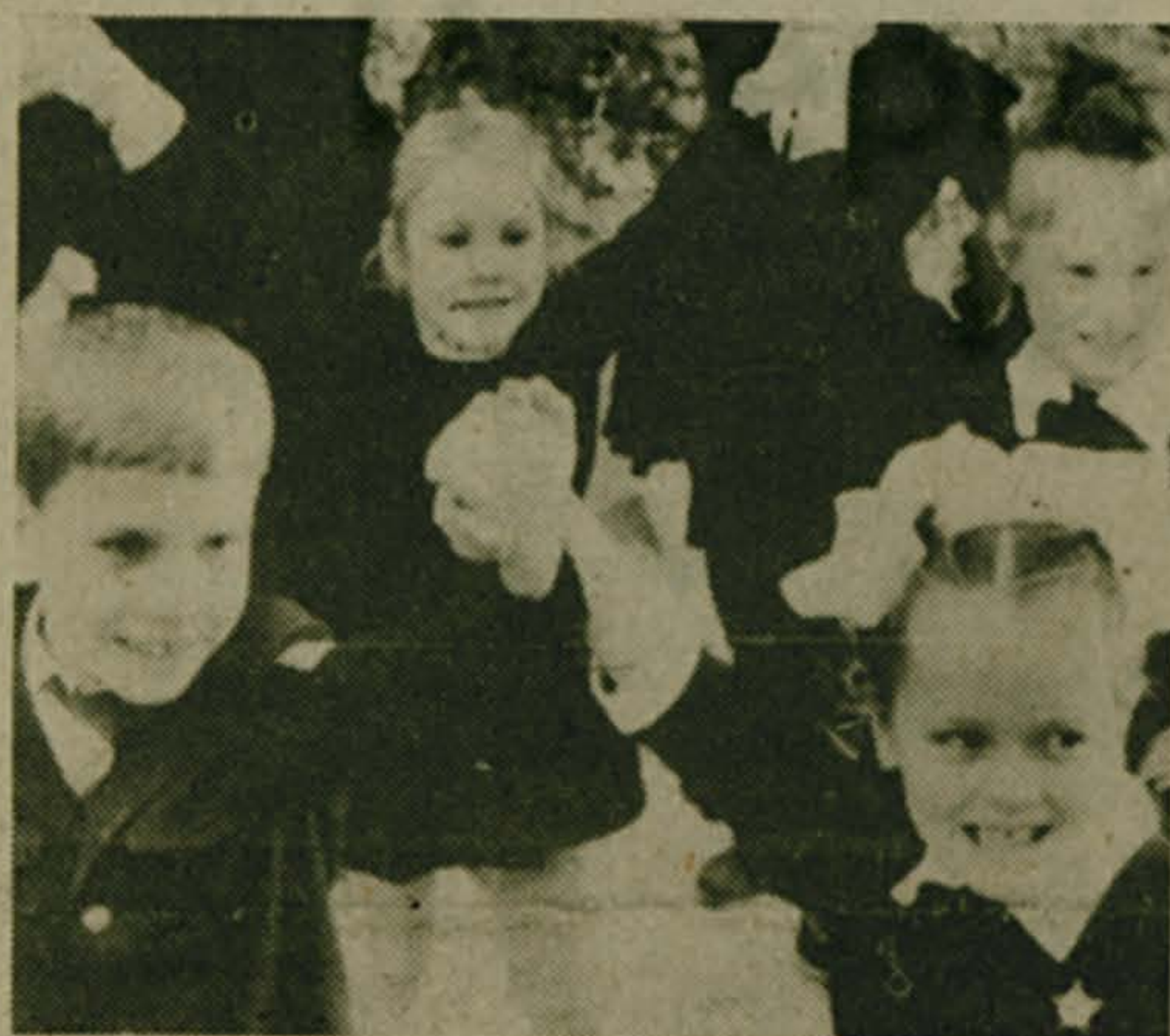
«Профессора» идут в школу

Социальная ориентация инвалидов — особенно молодых людей — нравственный долг общества. Здесь мы тоже, к сожалению, позади планеты всей.