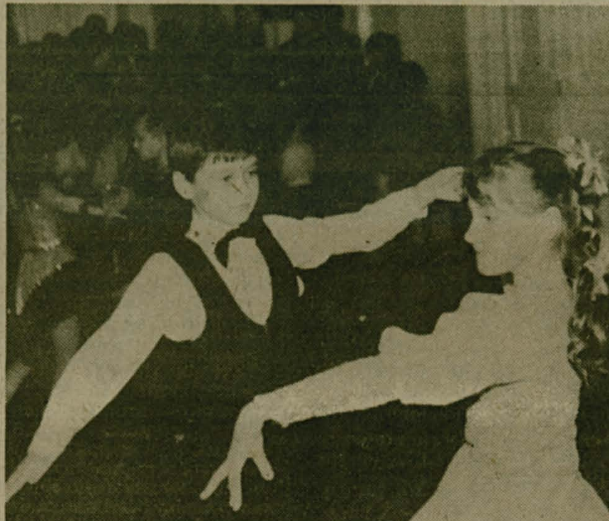
В клубе Малаховского экспериментального завода состоялся детский конкурс бальных танцев. В нем участвовали юные пары, занимающиеся в клубе, Малаховском Доме пионеров, а также в Доме культуры совхоза «Раменский», расположенного по соседству.

Исполнялись медленный вальс, блюз, самба, джайв и другие танцы. Воспитанники детского сада показали танец «Чебурашка».