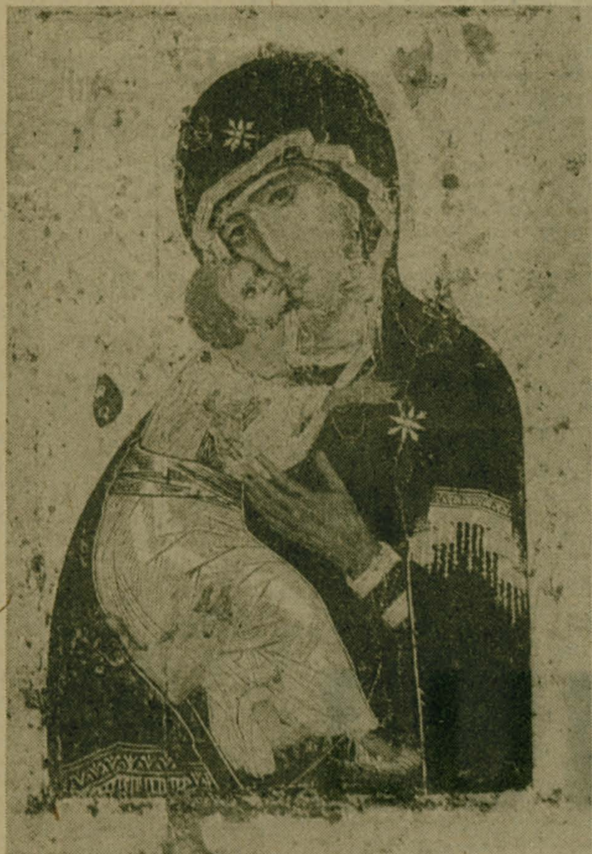
Об иконе Богоматерь Владимирская

Икона первоначально находилась в Вышгороде под Киевом, куда была привезена из Константинополя. В 1155 году князь Андрей Боголюбский привез в Владимир, где она получила свое название. В 1395 году, когда на Москву двинулся завоеватель Востока Тамерлан, икону доставили из Владимира в Успенский собор Московского Кремля. В «Житиях святых» повествуется о том, что великий князь Василий Дмитриевич вышел с войском к Коломне и стал молиться «с христоролюбивым воинством своим и всеми верноподанными Богу и Пресвятой Богородице об избавлении своего Отечества. А Тамерлану в ту же ночь приснился сон «в сиянии лучезарном — жена, благоговения и величия неописанного, которая повелела ему оставить пределы России». Он велел своим полкам идти обратно, к изумлению русских и татар. Икона была возвращена во Владимир, но оттуда с ней связывались все победы над Ордой. Окончательно ее перенесли в Москву в 1480 году.