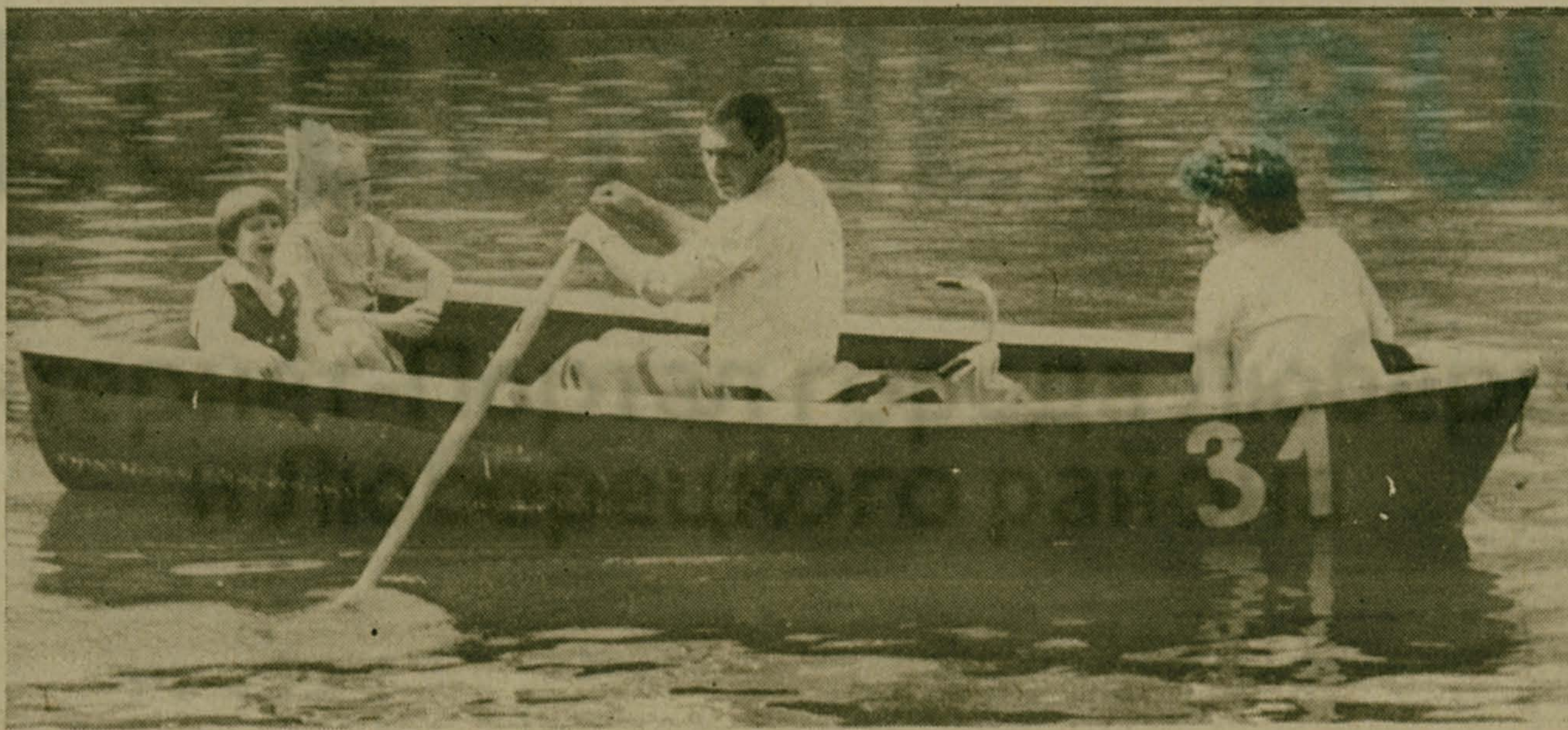
Четверо в лодке, не считая велосипеда.

При бассейне «Лидер» г. Лыткарино ОТКРЫТА БАНЯ-САУНА. Часы работы с 8 до 22-30, кроме воскресенья. Оплата за наливной и безналичный расчет. Телефон для справок 552-19-47 с 18 до 20 часов.