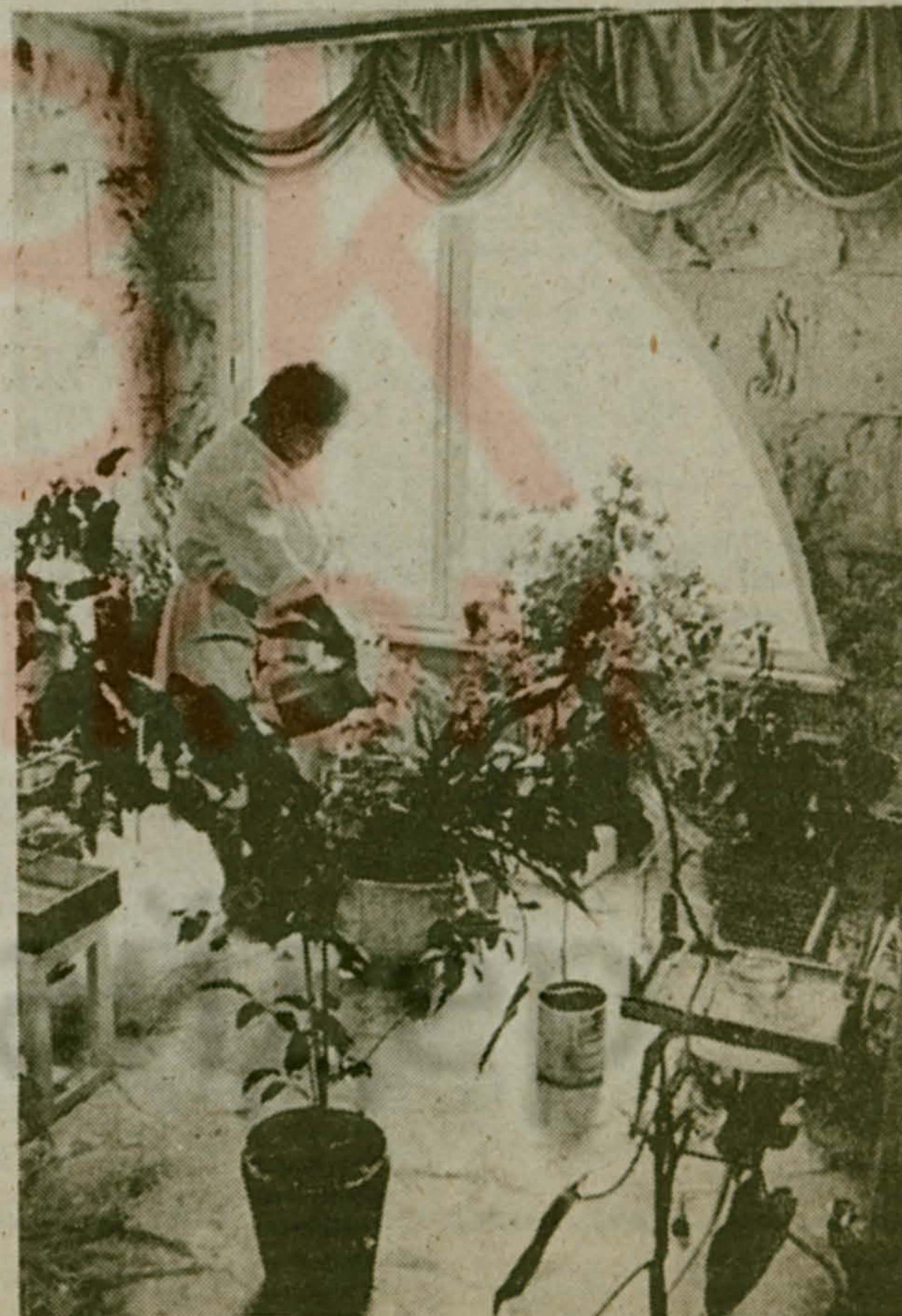
Гордятся сотрудники поликлиники № 1 г. Балашихи своим зимним садом. В горшках, кадках, кашпо, на специальных подставках и прямо на полу разместились кустики, лианы, деревца, радужа глаз сочной зеленью, причудливой формой, разнообразием красок и оттенков.

Уровень самбо в последние годы у наших спортсменов достаточно возрос. Основную конкуренцию на чемпионате составили между собой команды Болгарии, Франции, Монголии, а также стран бывшего СССР. Схватки во всех весовых категориях проходили напряженно и драматично. В командном зачете сборная России заняла третье место. Это неплохой результат, учитывая нынешние трудности в подготовке к соревнованиям, с которыми приходится сталкиваться нашим спортсменам.