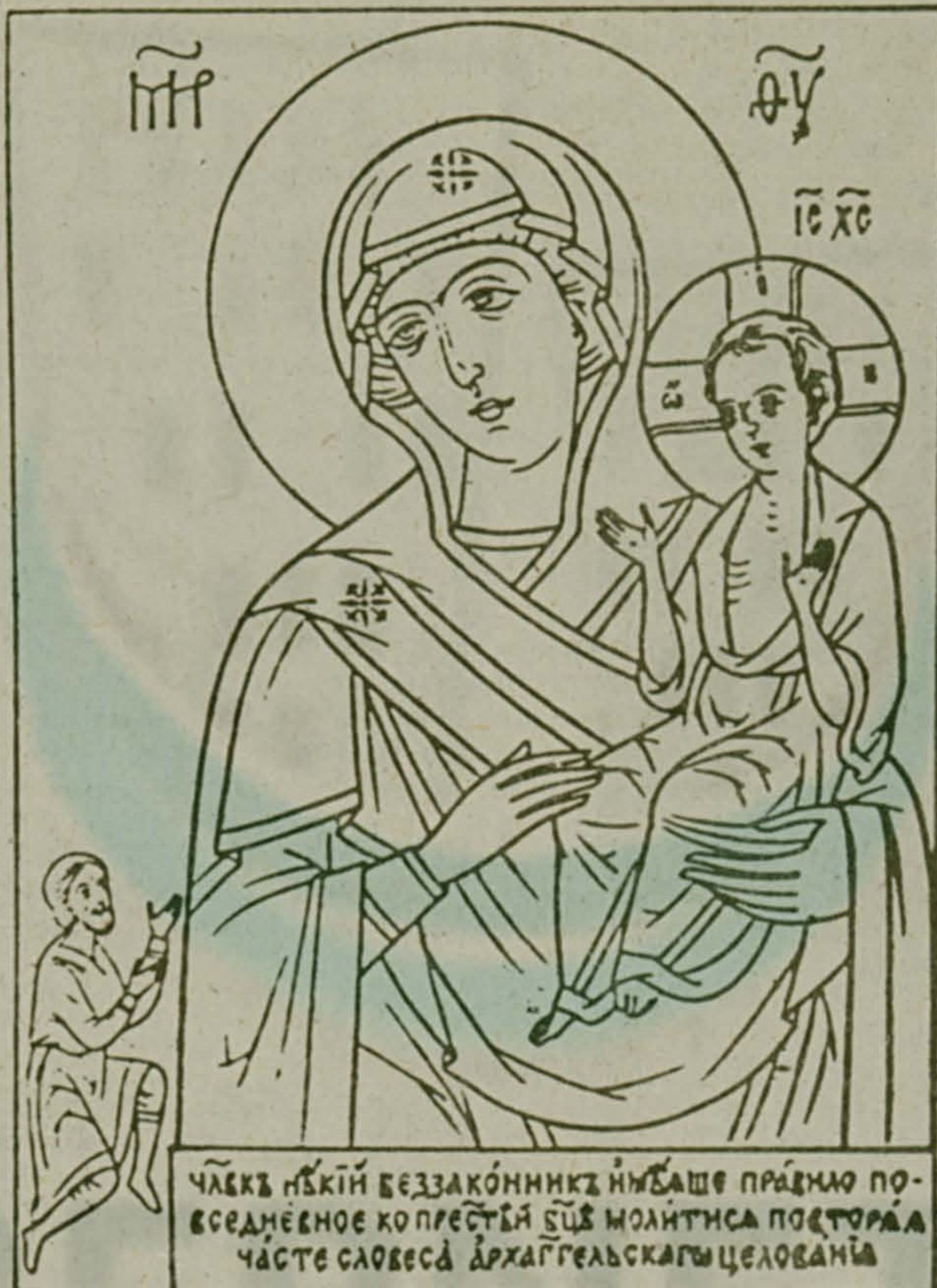
ЧЛЕРКЪ НБКІЙ БЕЗАКОННИКЪ НЫБШЕ ПРАВДНО ПОВСЕДНЕВНОЕ КОПЛЕСТЬ СЪБ МОЛИТНСА ПОСТОРБА ЧАСТЕ СЛОВЕСА АРХАГГЕЛЬСКАГЪ ЦЕЛОВАНІА

На снимке: Икона «Нечаянная Радость».