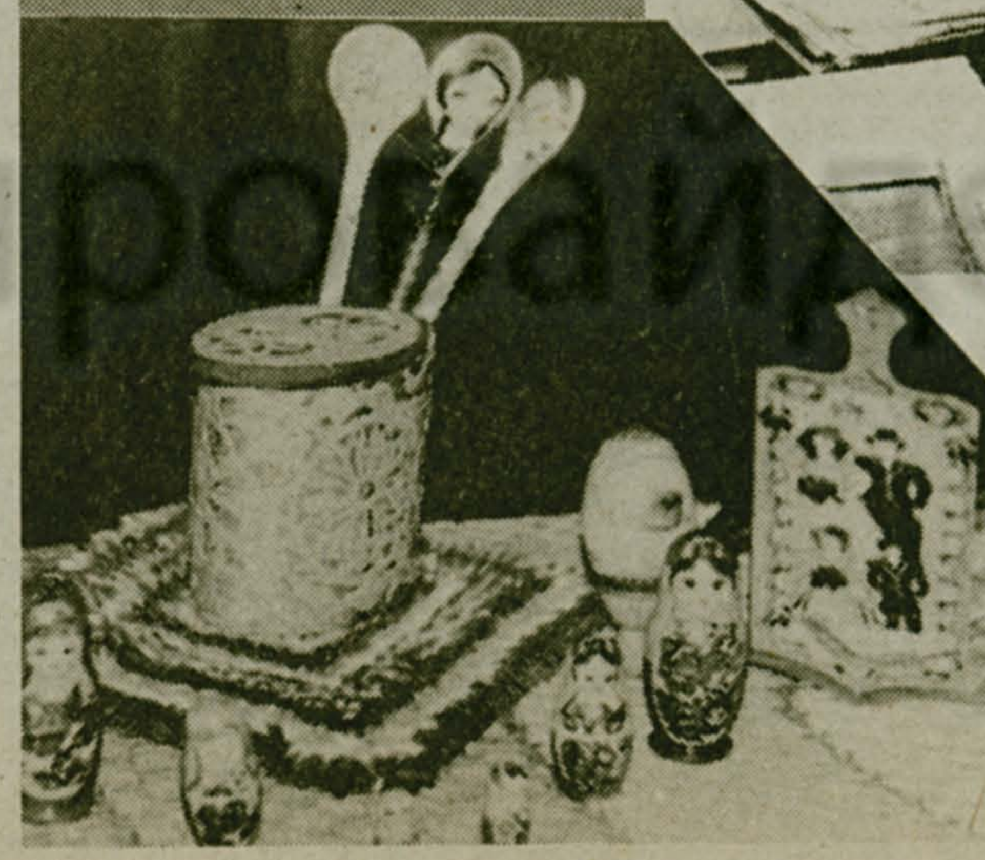
Полоса подготовлена под общей редакцией зав. корпусом Л. П. ШУТОВОЙ.