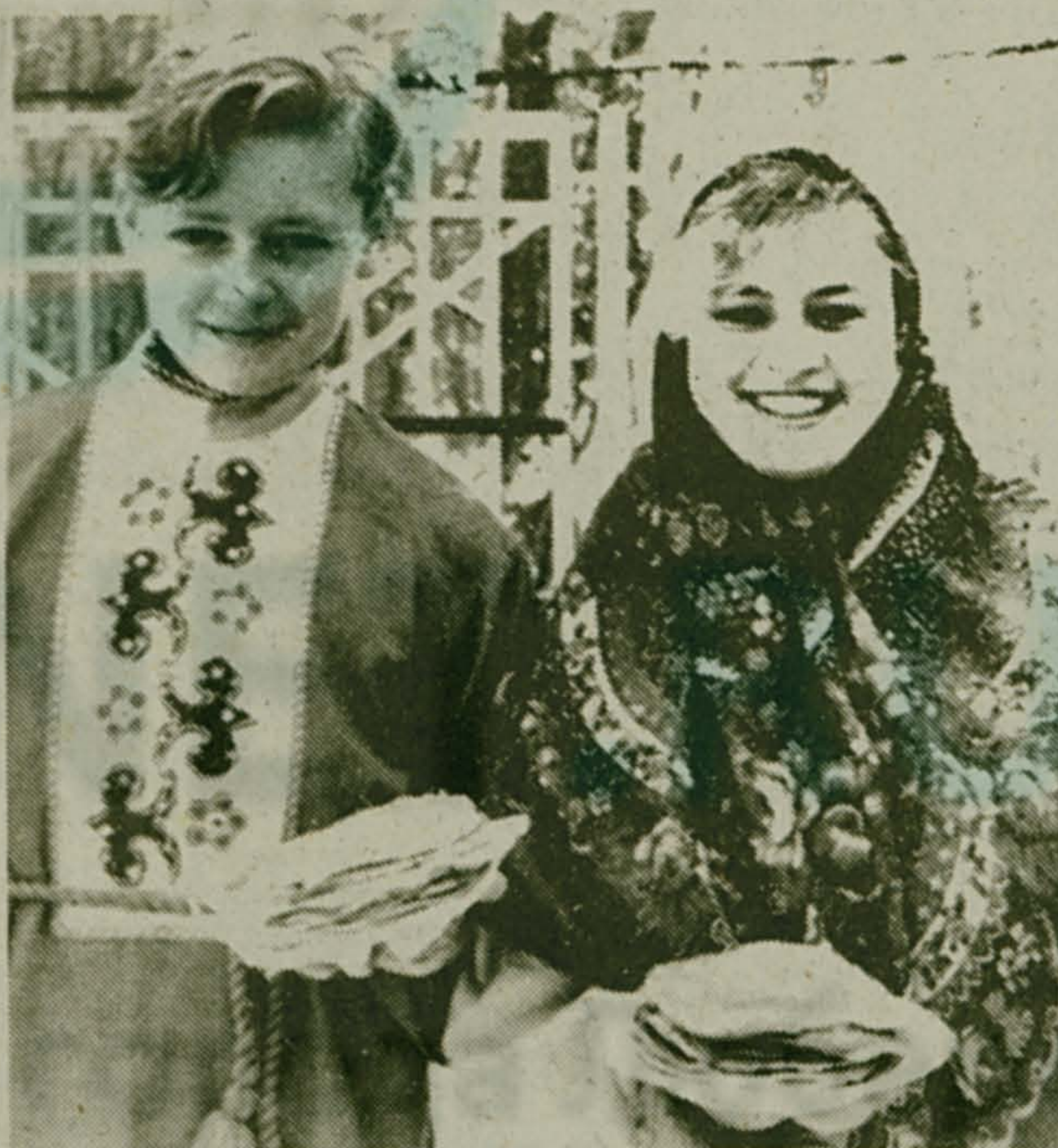
Репортаж из городского парка культуры и отдыха сделала Наталья Рыбина.