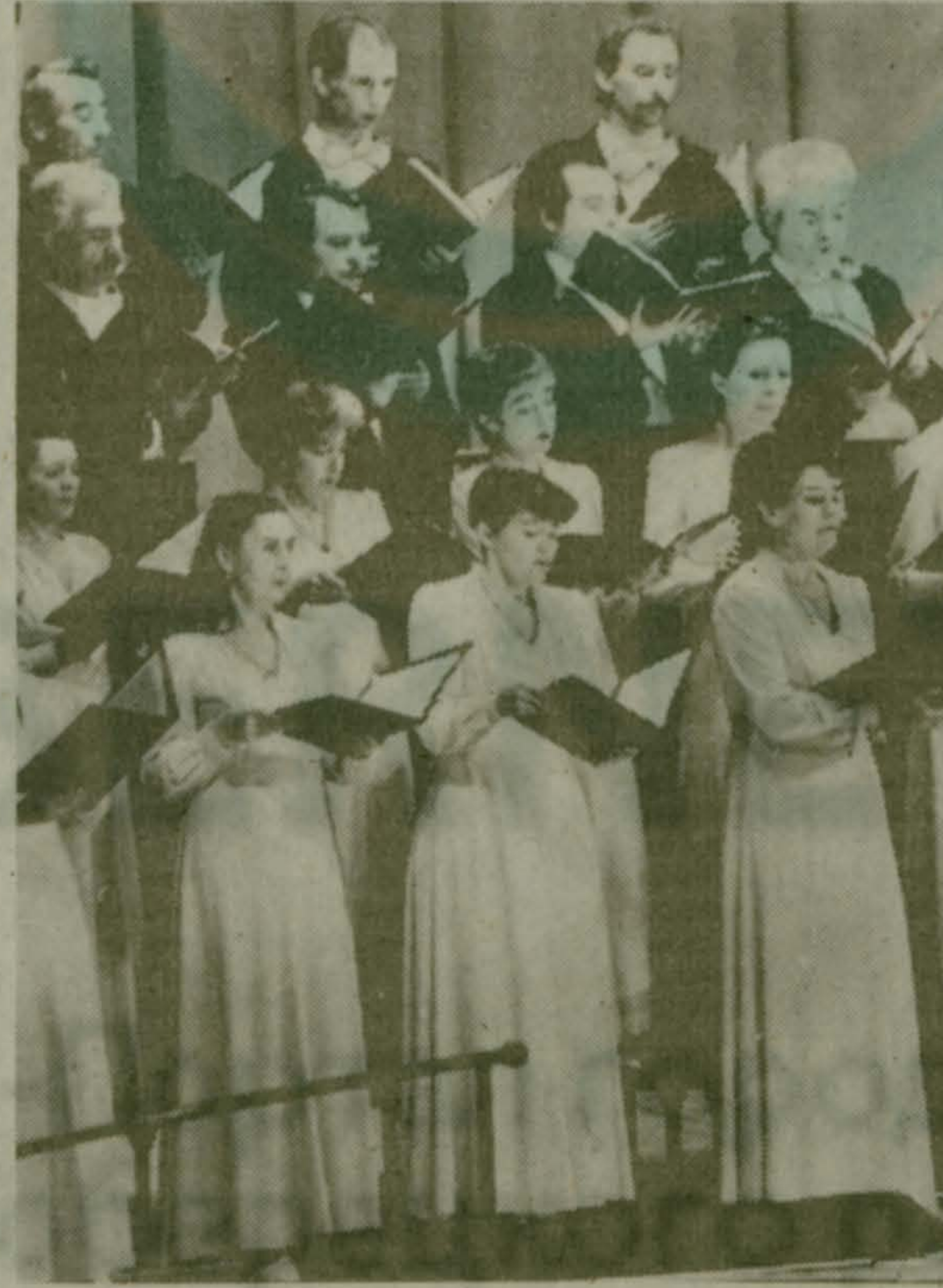
У нас в гостях